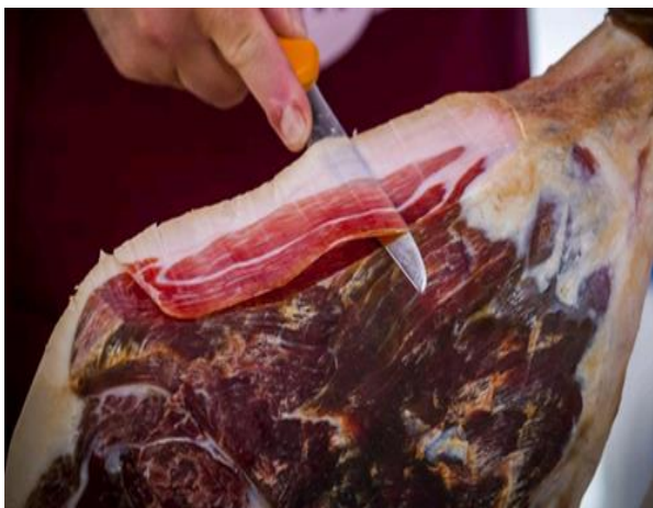
Slika 2. Pršut