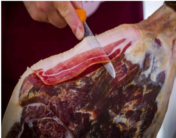
Slika 2. Pršut