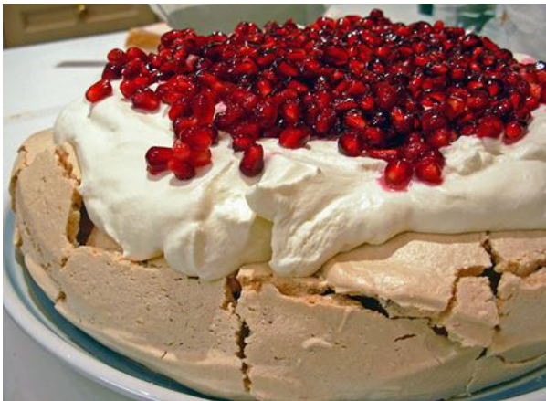
Slika 3. Pavlova

Koristili su se i bobičastim voćem i medom. Sve te namirnice nazivaju se australskim autohtonim „bush food“-om. Kultura kave je zastupljena od davnina jer su upravo u Sydney-u i Melbourne-u osnovani prvi objekti koji su posluživali grčku kavu te kasnije talijanski „espresso“. Na lokalnim tržnicama Zapadne Australije prodaju se sezonske namirnice koje uzgajaju lokalni poljoprivrednici, od voća i povrća su najzastupljenije jabuke, banane, kivi, naranče, mango, kruške, nektarine, ananas, razno bobičasto voće (jagode, maline, borovnice), artičoke, poriluk, tikvice, gljive, brokule, kaul, kupus i krastavci. Kod pripreme mesnih recepata poput mesnih pita najčešće se koristi ovčetina i janjetina dok se meso klokana priprema u manjoj mjeri. U luksuznim restoranima kao poslastica poslužuju se jela od mesa emua i krokodila. Tradicionalni kolači koji se spremaju povodom proslava su soldier's cake, anzac biscuits, lamingtons i torta pavlova. Tradicionalni kruh damper i čaj Billy tea su neizostavan dio svakog doručka.