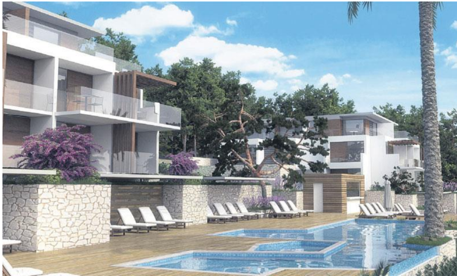
Slika 4: Valamar Girandella u Rapcu

Grupacija zahvaljujući kontinuitetu ostvarivanja dobrih rezultata i predviđanjima nastavka uspješnog poslovanja planira ulaganja od 1,5 do 2 milijarde kuna u periodu od 2016. do 2020. godine. Za 2017. godinu nadzorni odbor je odobrio 873 milijuna kuna od čega se glavnina odnosi na ulaganja u objekte s 4 zvjezdice – Family Life Bellevue Resort i Valamar Girandella Resort u Rapcu te kampove Lanterna u Poreču i na Krku te ulaganja u podizanje konkurentnosti i kvalitete. 55