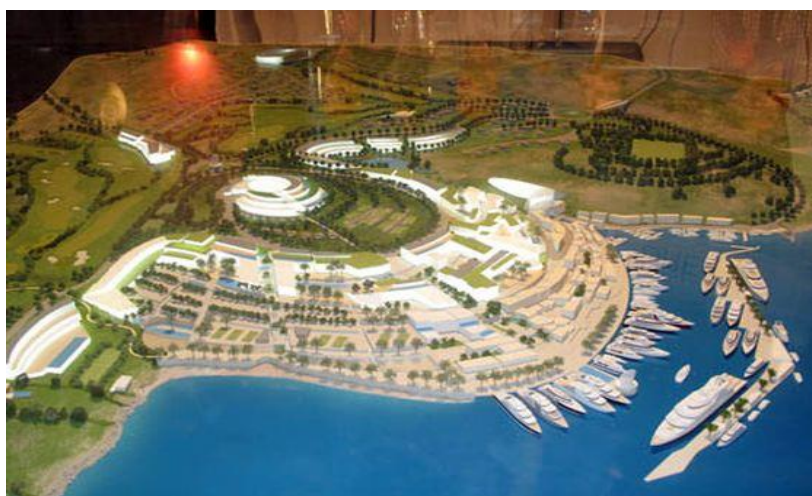
Slika 6 : Vizualizacija projekta 3 sestrice

Projekt se nalazi na području od posebne državne skrbi Republike Hrvatske što mu donosi određene porezne olakšice i mogućnost smanjenja komunalnog doprinosa. Za projekt "3 sestrice - Hrvatski san" otkupljeno je potrebno zemljište i uz riješenu prostorno-plansku dokumentaciju to je najspremniji turistički projekt koji može započeti s realizacijom. Ukupna vrijednost projekta je 920 milijuna eura 57 . Radi se o najvećem turističkom projektu u Republici Hrvatskoj za kojeg nositelj projekta traži investitore.