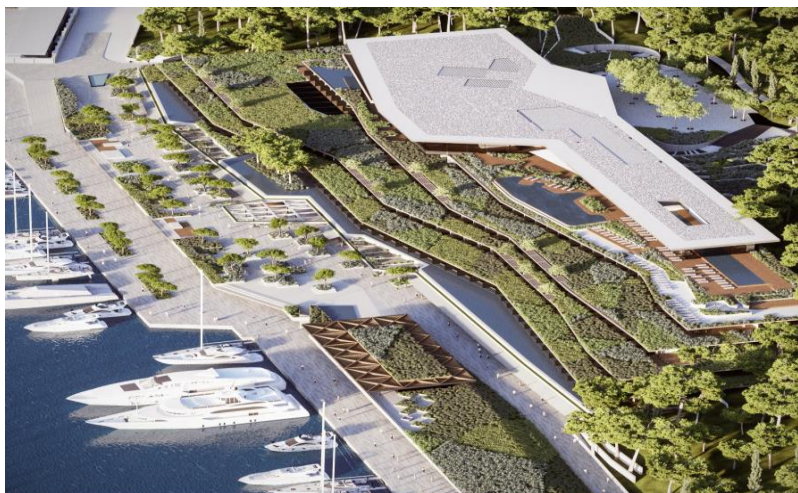
Slika 5 : Vizualizacija novog hotela Park u Rovinju

Adris Grupa sastoji poslovanje temelji na turizmu, osiguranjima, marikulturi i proizvodnji duhanskih proizvoda. Ostvaruje izuzetne poslovne rezultate (u prvih 10 mjeseci 2016 ostvareno 4 milijarde kuna prihoda te 570 milijuna kuna neto dobiti) te nastavlja ulaganja i širenje kapaciteta uz snažnu orijentaciju na turizam. Maistra je ključna kompanija unutar grupacija kroz koju se planira plasirati više od 1,6 milijardi kuna do 2019., ulaganjima u Rovinj, a očekuje se i iskorak u atraktivne destinacije kupnjom postojećih ili gradnjom novih hotela. U 2017. najavljena turistička ulaganja iznose 450 milijuna kuna od čega se glavnina odnosi na gradnju hotela Park u Rovinju (ukupna vrijednost investicije 600 milijuna kuna) te na povećanje kvalitete u kampovima. 56