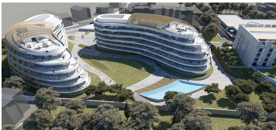
Slika 7: Vizualizacija hotela Hyatt u Zadru

Drugi veliki projekt je preuzimanje šibenskog NCP-a, gdje Turci zaokružuju investicije u šibensku Mandalinu podizanjem remontnog brodogradilišta na svjetsku razinu. Tim projektom biti će zaokružene investicije u šibensku Mandalinu; gdje se nalazi novi resort, u koji je zasad investirano 26 milijuna eura 59 . Turske investicije u luke nautičkog turizma čine ih, uz nekolicinu domaćih poduzetnika, najvažnijim pružateljima usluga u tom segmentu u Hrvatskoj (državno upravljanje ACI-jem zaustavilo je razvoj i formiranje adekvatne ponude). Dogus grupa vlasnik je triju marina na Jadranu te udjela od 11% u ACI-ju te planiraju dajnja ulaganja u Hrvatsku.