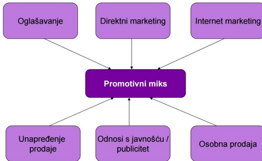
Slika 2. Elementi promotivnog miksa