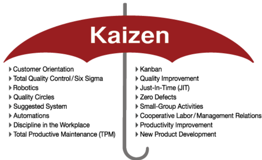
Slika 1: Kaizen kišobran