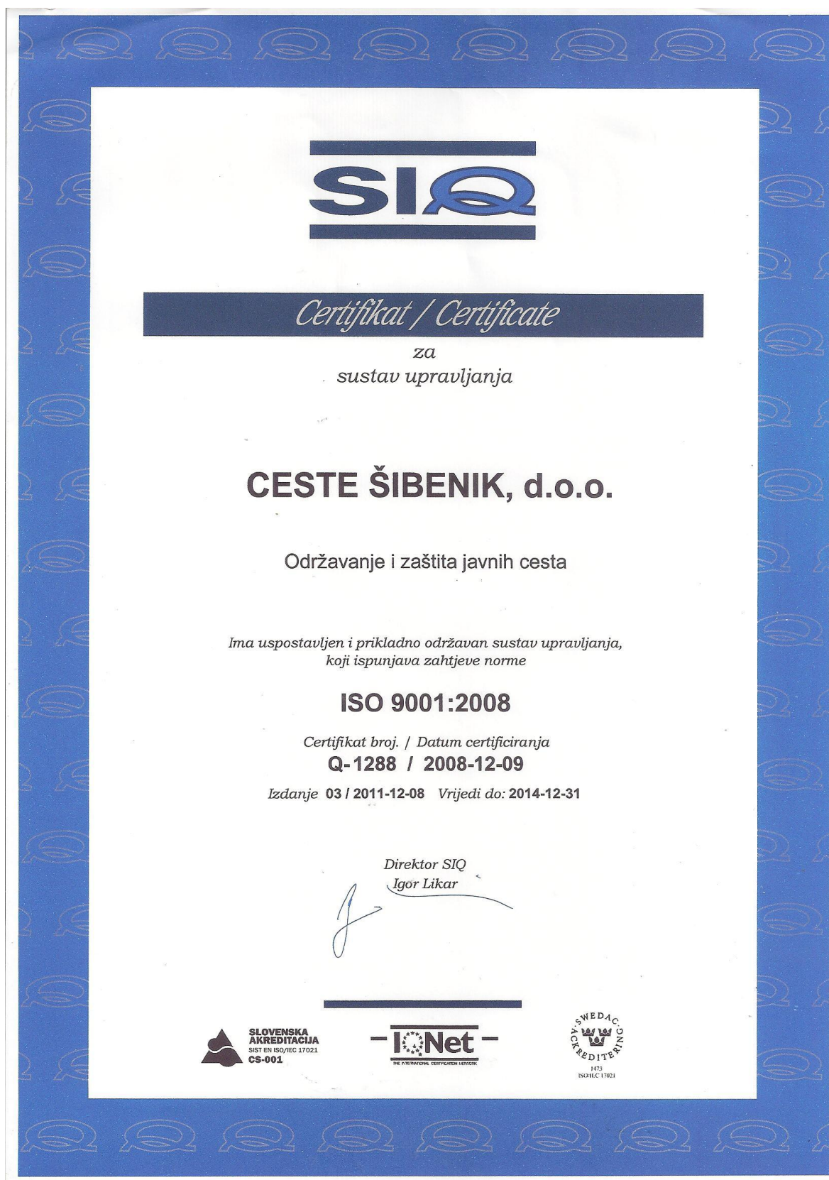
Slika 3: Certifikat za sustav upravljanja dodijeljen poduzeću Ceste Šibenik d.o.o.