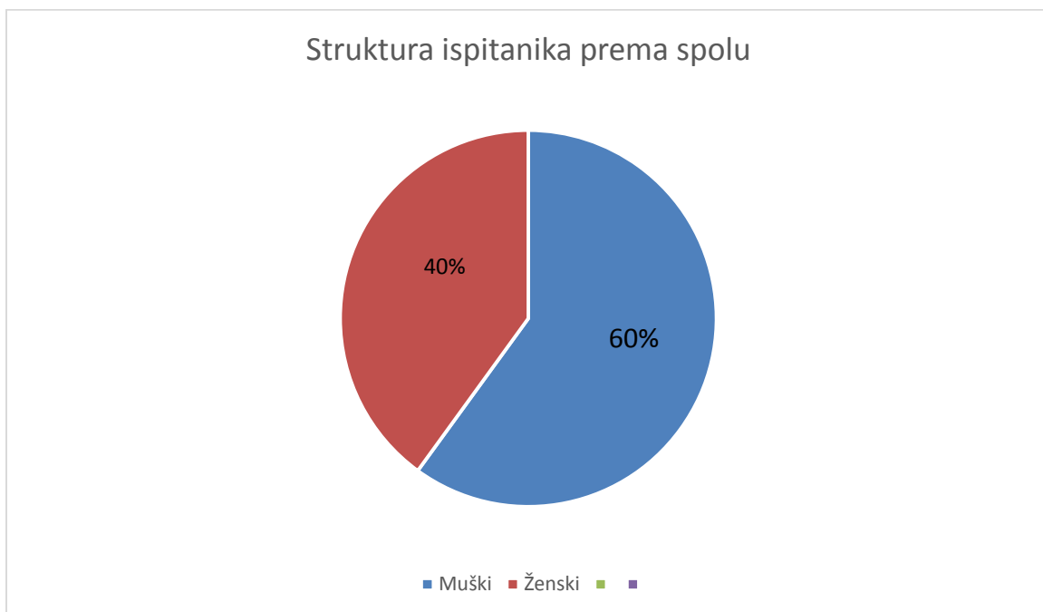
Grafikon 1. Struktura ispitanika prema spolu

Istraživanje je povedeno na uzorku od 15 zaposlenika od kojih su 40 % ženskog, a 60 % muškog spola. Rezultati nam pokazuju da je u ispitanom odjelu zaposleno više muškaraca nego žena.