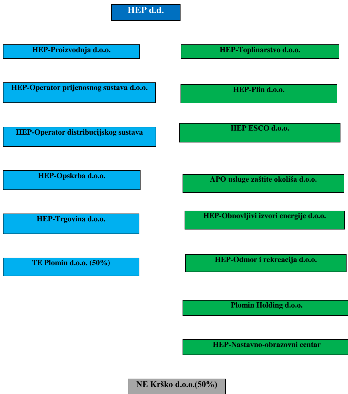
Slika 2: Organizacijska struktura poduzeća „HEP“