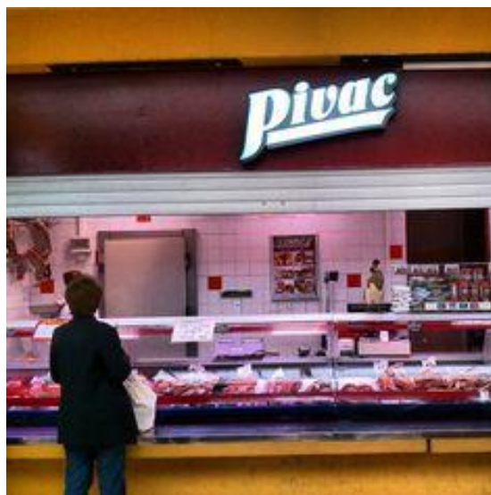
Slika 7. Mesnica Mesne industrije Braća Pivac d.o.o.

Svaka mesnica diljem Republike Hrvatske ima minimalno 2 klime te nekoliko rashladnih uređaja u kojima stoje naši proizvodi, ovisno o kvadraturi. A kada je riječ o kvadraturi to je obično 15-20 metara kvadratnih ako se mesnica nalazi u centru grada, a na svim ostalim mjestima je riječ od 30 do 50 kvadrata.