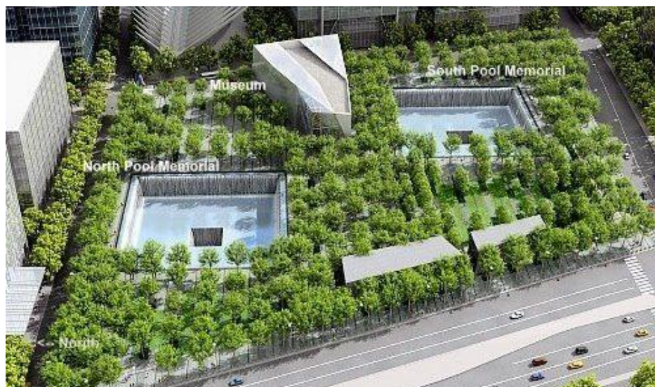
Slika 7: Ground Zero, memorijalni muzej i bazen

Svjetski trgovački centar, poznatiji kao Ground Zero, bio je kompleks od sedam građevina u donjem dijelu Manhattana u New York Cityju. Dva najviša tornja "Američki Blizanci" uništena su u terorističkim napadima 11. rujna 2001. zajedno sa zgradom broj 7. Rušenje dvaju tornjeva teško je oštetilo ostale zgrade kompleksa pa su s vremenom i one srušene, a tog dana stradalo je oko 3000 ljudi. U spomen na poginule izgrađen je memorijalni muzej i veliki reflektirajući bazen s vodopadima, a njihova imena ispisana su na brončanoj ploči na rubu memorijalnog bazena. Svake godine dobiva oko 1.000.000 posjetitelja.