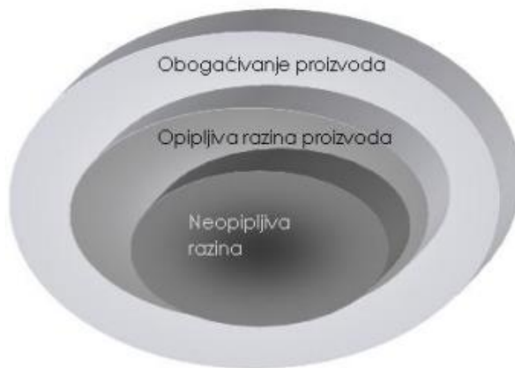
Slika 1. Tri