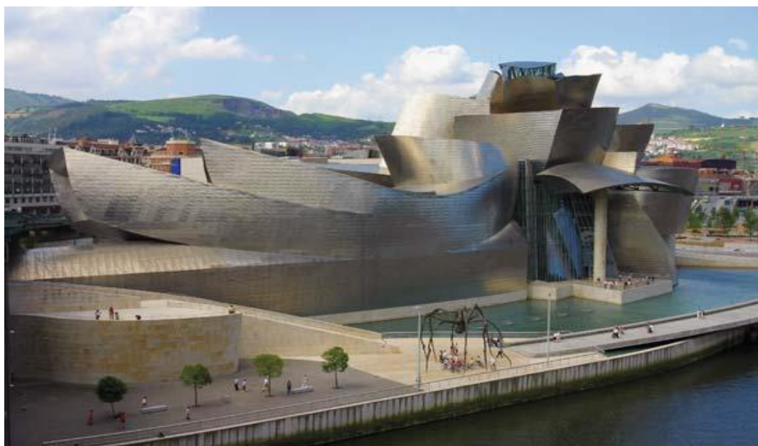
Slika 2. Muzej Guggenheim u Bilbaou