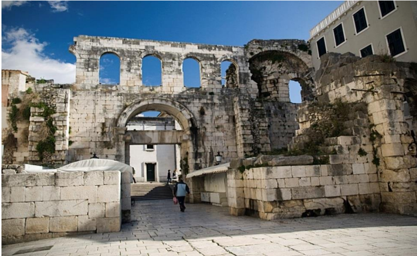
Slika 6. Srebrna vrata