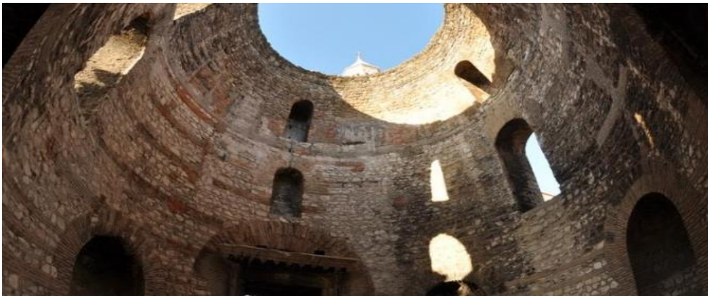
Slika 4. Vestibul