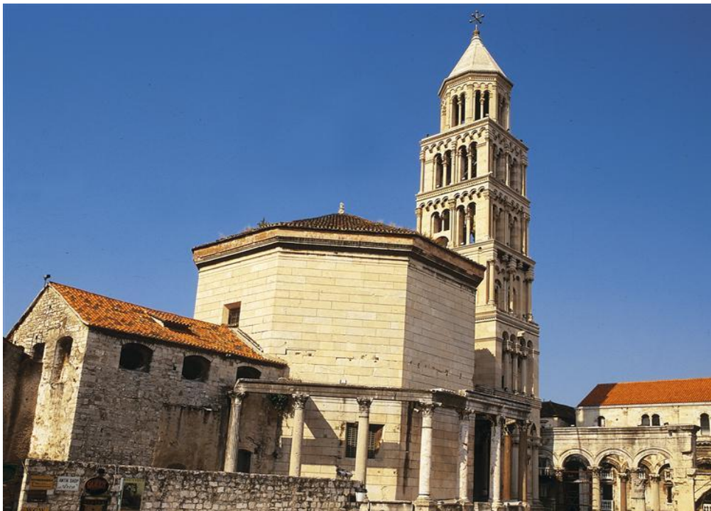
Slika 5. Dioklecijanov mauzolej (Katedrala sv. Dujma)