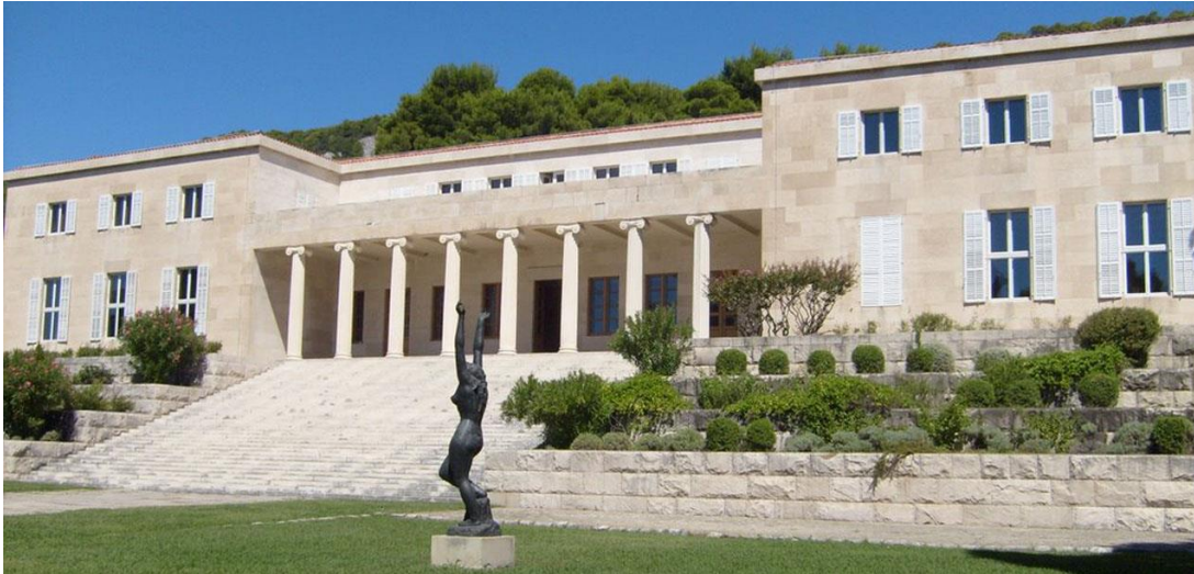
Slika 7. Galerija Meštrović