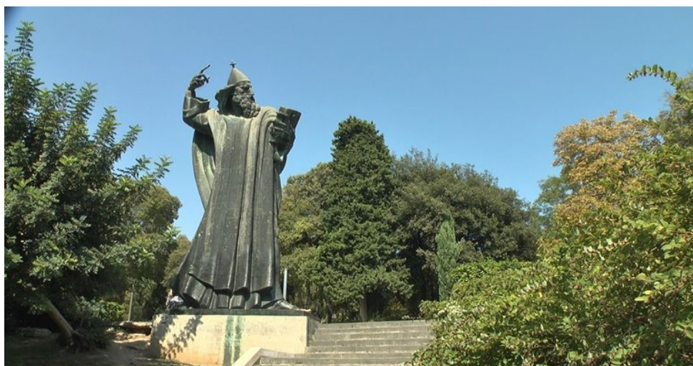
Slika 10. Grgur Ninski