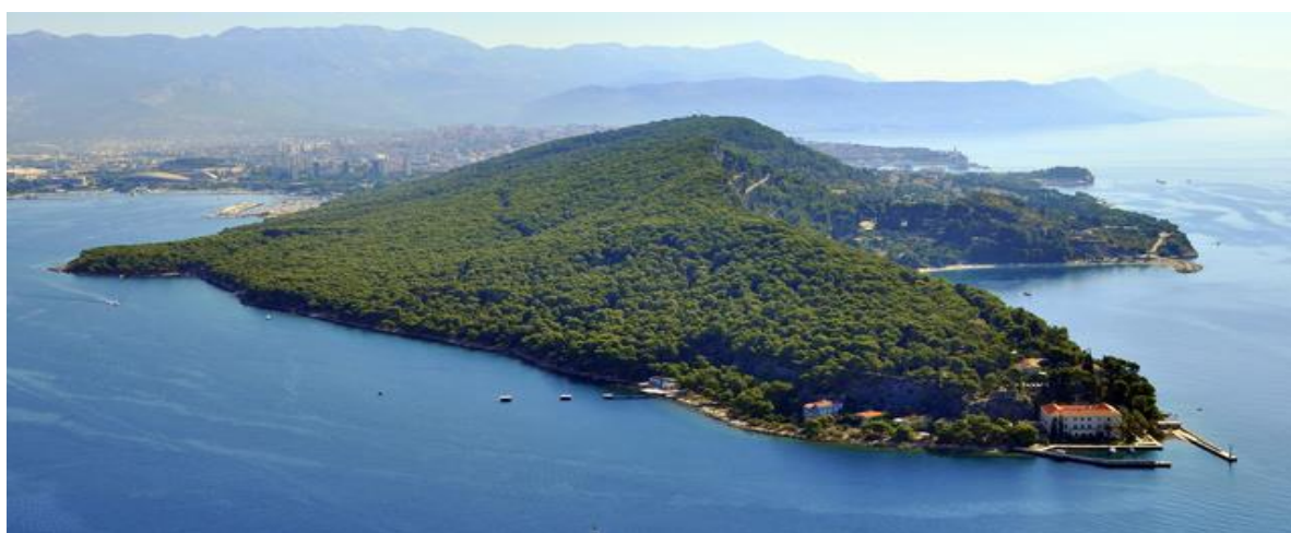
Slika 15. Park-šuma Marjan