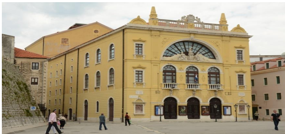
Slika 11. Hrvatsko narodno kazalište u Splitu