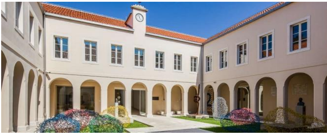
Slika 9. Galerija umjetnina Split