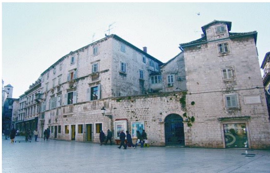
Slika 13. Kuća Pavlović na Pjaci