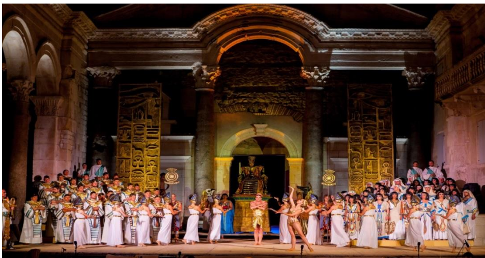
Slika 16. Splitsko ljeto 2015.godine – izvedba 'Aide' na Peristilu