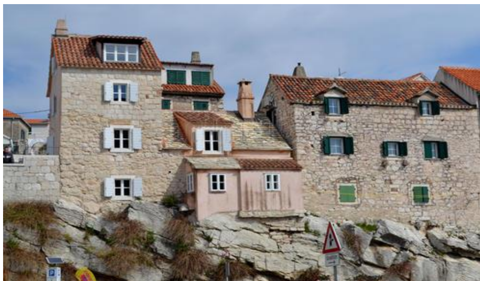
Slika 12. Veli varoš