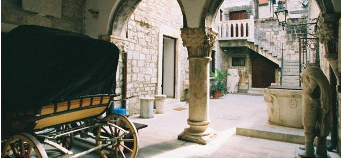
Slika 8. Muzej grada Splita