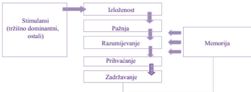
Slika 2. Proces prerade informacija

Informacije s tržišta o ponudi drugih tržišnih subjekata su jedan od vanjskih činitelja koji modificira ponašanje krajnjeg potrošača. Te informacije mogu doći od prijatelja i znanaca koji svoje savjete temelje na vlastitom iskustvu i stvorenom mišljenju tijekom potrošnje proizvoda, odnosno korištenja usluga. 9 Prerada informacija je početna faza u procesu donošenja odluke u kupnji i stoga je od izuzetnog značaja za strategiju promotivnih aktivnosti. Prerada informacija prolazi kroz nekoliko faza kako je prikazano na slici 2.