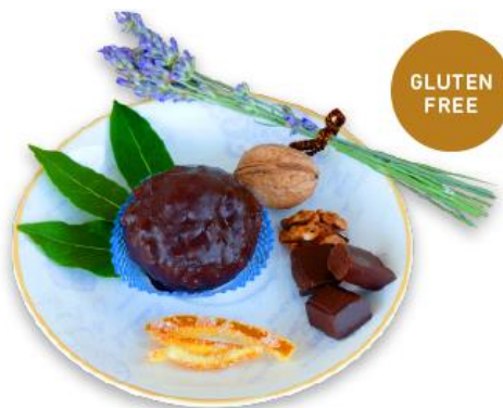
Slika 7

Ime asocirano oblikom topovske kugle, a na spomen svjetski poznate bitke u kojoj je zarobljen MARKO POLO i koja se odvijala baš ispred grada Korčule. Bombica “Marko Polo” je kreativni proizvod novog doba, koji će tek ući u korčulansku tradiciju. Riječ je o pravoj gluten free kalorijskoj bombi – kuglici od fine kreme, posute fino sjeckanim orasima, a zatim omotane debelim slojem čokolade. Kod ove deliciozne kombinacije dolaze na svoje obožavatelji čokolade.