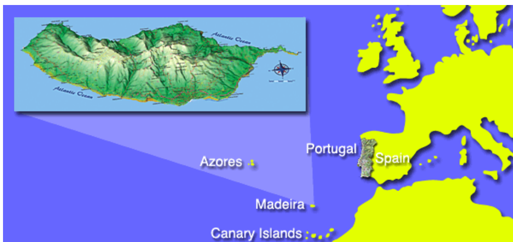
Slika 1: Položaj otoka Madeira