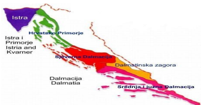
Slika 2. Jadranska regija

Jadranska regija je uvjerljivo najvažnija turistička regija Republike Hrvatske te obuhvaća preko 95% smještanih kapaciteta i 85% turističkih mjesta.