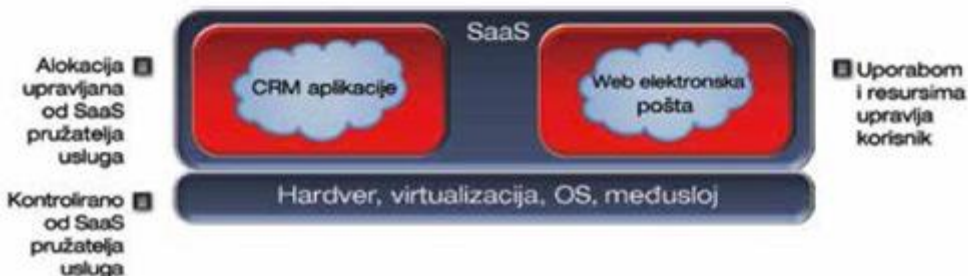
Slika 1 . Prikaz primjene računarstva u oblaku 2

Postoji više modela računalnih oblaka: javni, privatni, zajednički, hibridni i kombinirani. Javni oblak se ostvaruje na način sličan bilo kojoj javnoj usluzi, na primjer poput plina ili struje: javi se davatelju usluge i davatelj usluge ispostavlja račun za ono što je korisnik stvarno koristio.