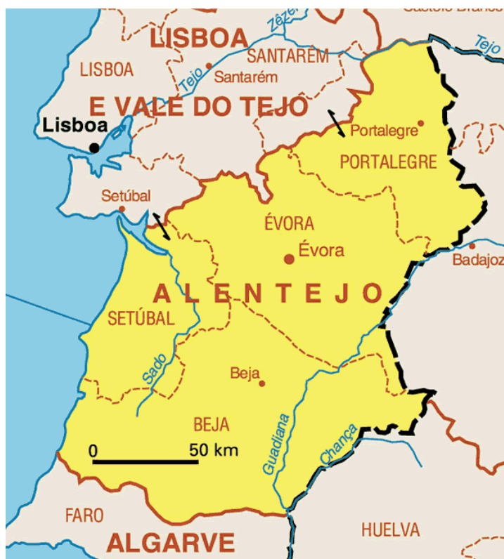
Slika 13. Karta regije Alentejo