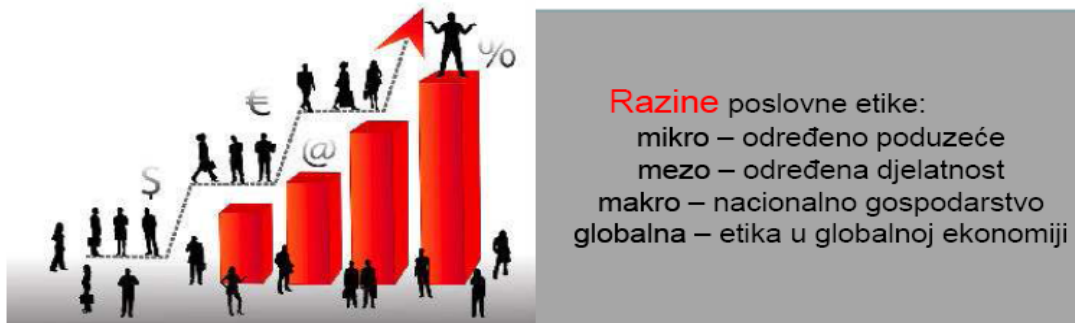
Slika 3. Razine poslovne etike

Poslovna etika je primjena etičkih principa u poslovnim odnosima i aktivnostima.