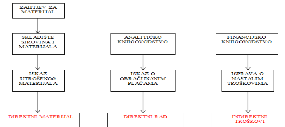
Slika 2. Shematski prikaz kretanja dokumentacije proizvodnje u poduzeću „Mel“

Za knjiženje nastalih poslovnih promjena u poduzeću „Mel“ sastavlja se iskaz izdanih sirovina i materijala, iskaz obračunanih plaća radnika u pogonu, raspored općih troškova prema mjestima nastanka i predatnica. Financijsko knjigovodstvo prema podacima iz rasporeda općih troškova prema mjestima nastanka pruža informacije o neizravnim troškovima. Shematski prikaz kretanja dokumentacije u promatranom poduzeću nalazi se u nastavku rada te je prikazan na slici 2.