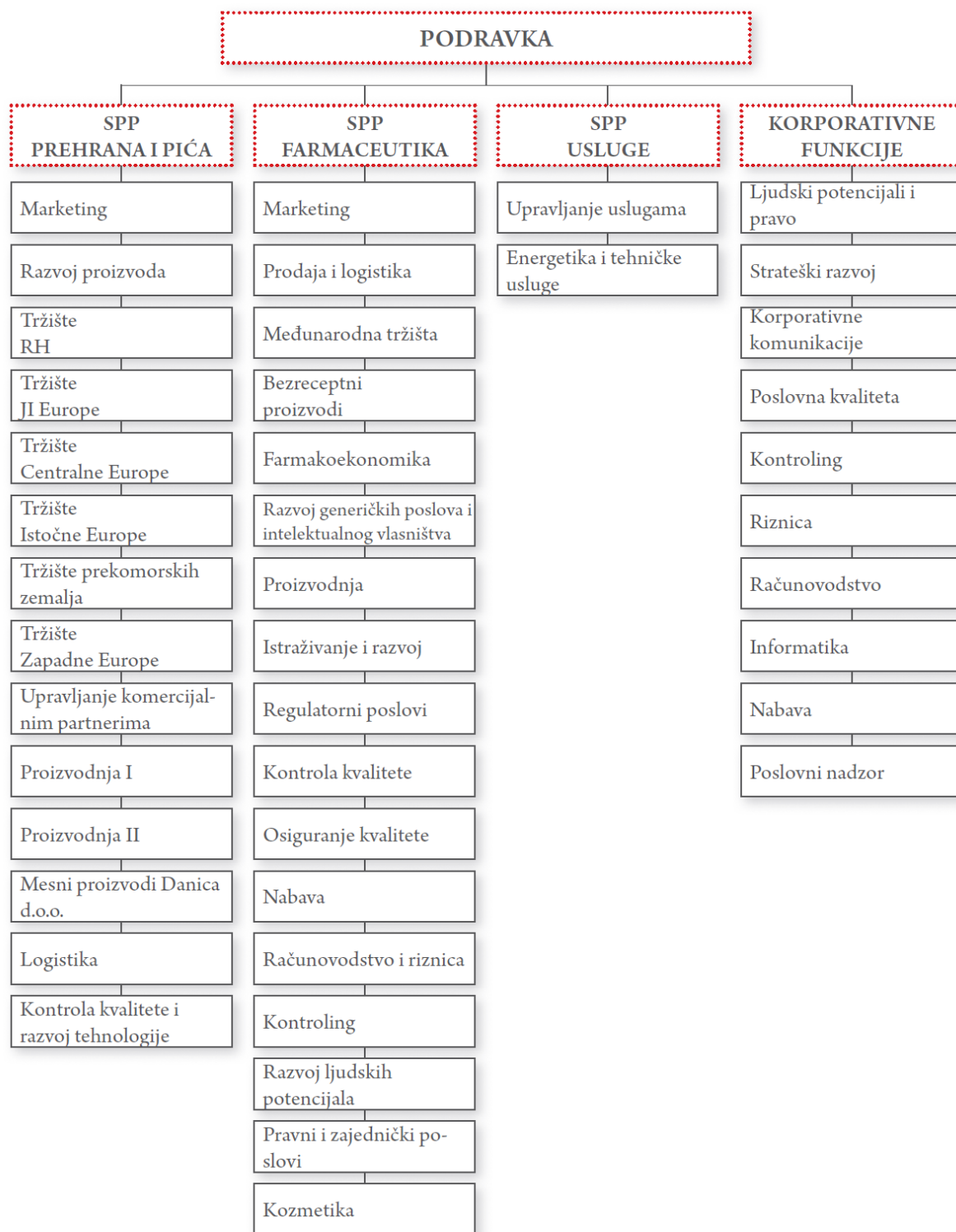
Slika 1: Organizacijska struktura Grupe Podravka