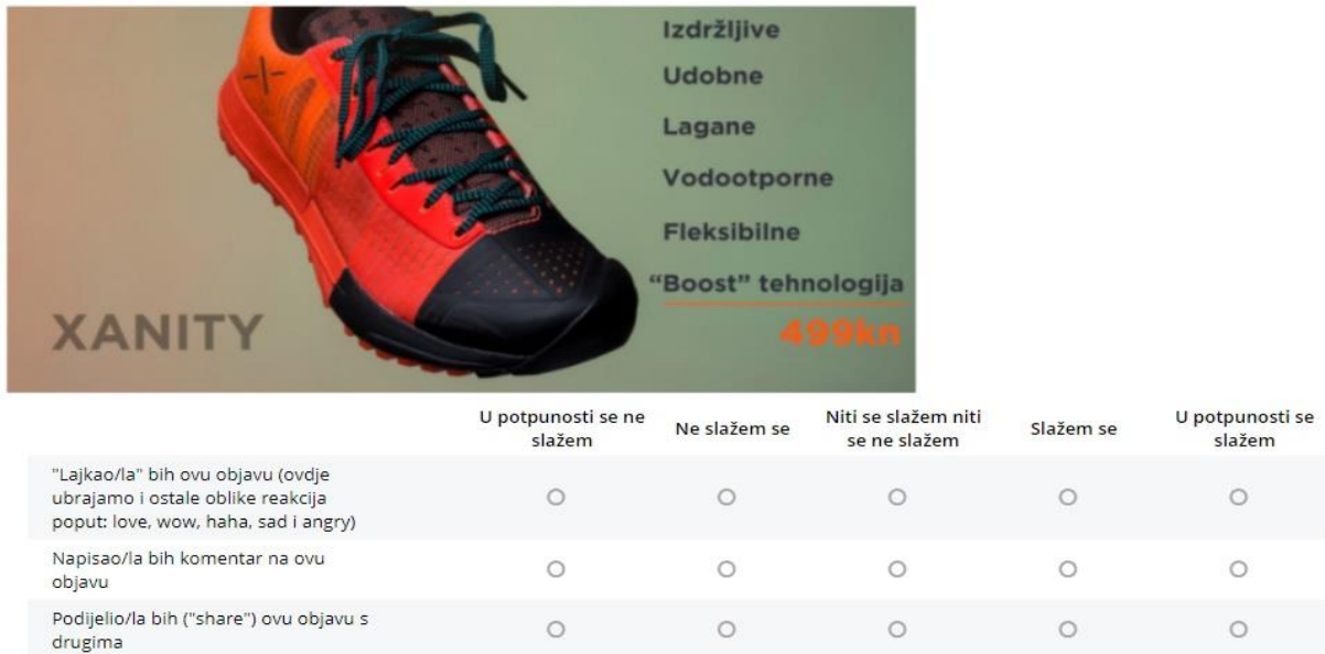
Slika 4. Primjer objave s funkcionalnim apelima

Nakon ljestvice slijedi kratko predstavljanje izmišljenog poduzeća Xanity (izmišljeno u svrhu reduciranja pristranosti ispitanika ukoliko bi riječ bila primjerice o Nike-u ili Adidasu svaki ispitanik bi u svojem ponašanju bio pod utjecajem prijašnjih iskustava s navedenim poduzećima) te Facebook objave poduzeća (također izmišljene). Kao što je već rečeno struktura upitnika je ista, ali jedna grupa ispitanika je dobila slike s funkcionalnim apelima dok je druga grupa dobila iste slike koje sadrže emocionalne apele u vidu teksta slike. Primjer je dan u nastavku.