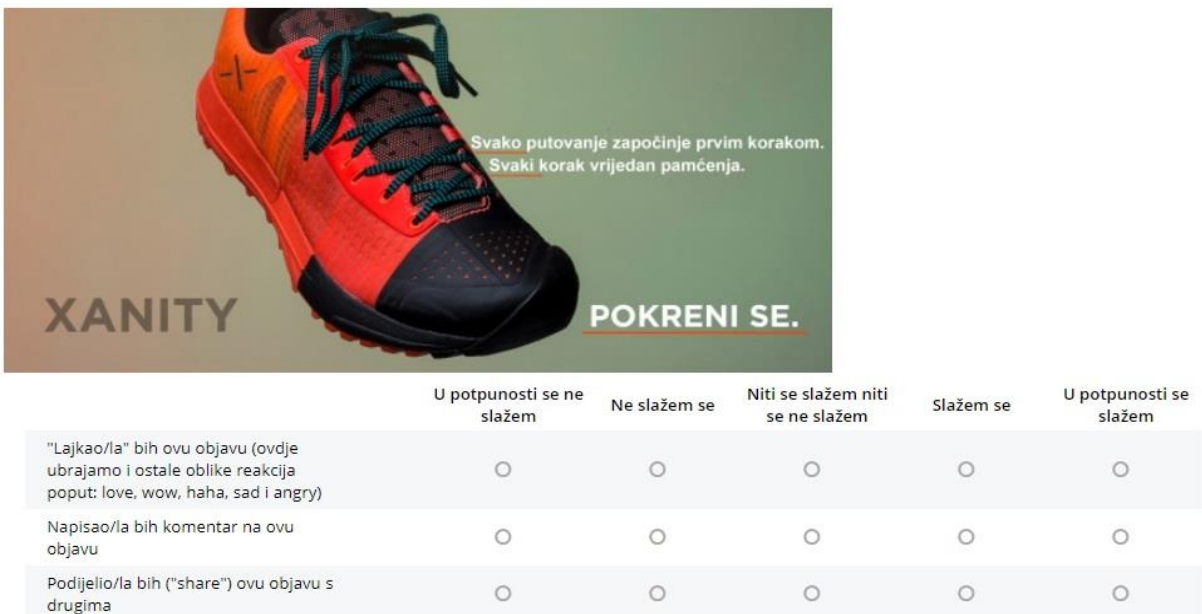
Slika 5. Primjer objave s emocionalnim apelima