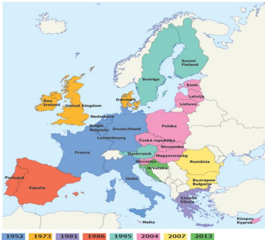
Slika 2. Povijest širenja Europske unije