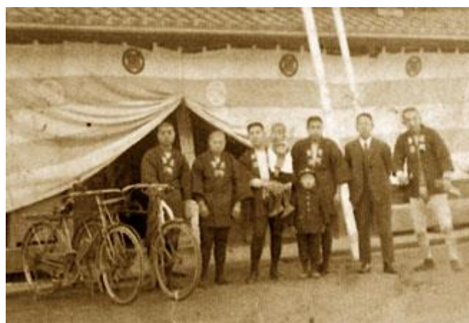
Slika 2: radnici poduzeća Kongo-Gumi