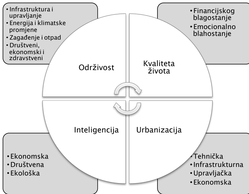
Slika 1. Karakteristike Smart City-ja

Izvor: Caragliu, A., Del Bo, C., & Nijkamp, P. (2011.) Smart cities in Europe. Journal of Urban Technology , 16(2), 65–82.