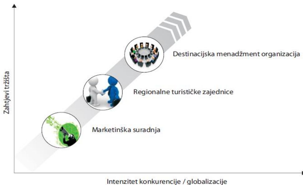
Slika 1: Povijesni razvoj modela upravljanja turizmom

Prethodno navedeno možemo vidjeti na slici 1 iz koje možemo zaključiti kako sve većim zahtjevima na tržištu te povećanjem konkurencije dolazi do razvoja destinacijskih menadžment organizacija.