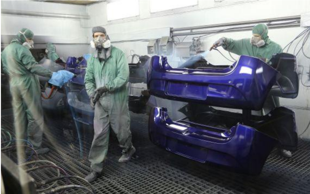
Slika 11. Zaštita zaposlenika na radu linije bojanja