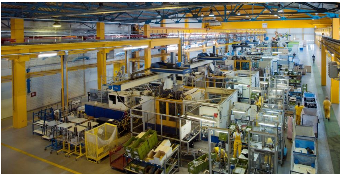
Slika 6. Proizvodni pogon AD Plastika

Renault je partner AD Plastika od 1992. godine kada je AD Plastik proizvodio dijelove za Renault Clio. Renault je 1999. godine preuzelo Rumunjsku tvrtku Dacia i tražila je pouzdane partnere za proizvodnju i razvoj novih vozila u Rumunjskoj. Proizvodnja se odvijala u prostorijama Dacie jer je donesen ugovor između Dacie i EURO APS (Simodles i AD Plastik) o dugoročnom najmu prostora što je bilo najisplativije za sve strane.