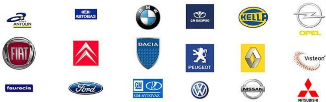
Slika 8. Poslovni partneri AD Plastika iz područja autoindustrije

Prethodno navedeni projekt poslovne suradnje AD Plastika sa Renaultom i Daciom je širom otvorila vrata brojnih drugih projekata posebno na području autoindustrije. U tome je izniman značaj imala kvaliteta proizvoda kojom su u Renaultu i Daciji iznimno zadovoljni. Najveći kupci s kojima AD Plastik uspješno razvija dugoročnu poslovnu suradnju su: Renault, Nissan, PSA, Ford, Opel, VW, Dacia, VAZ, Daewoo, Fiat, Mitsubishi.