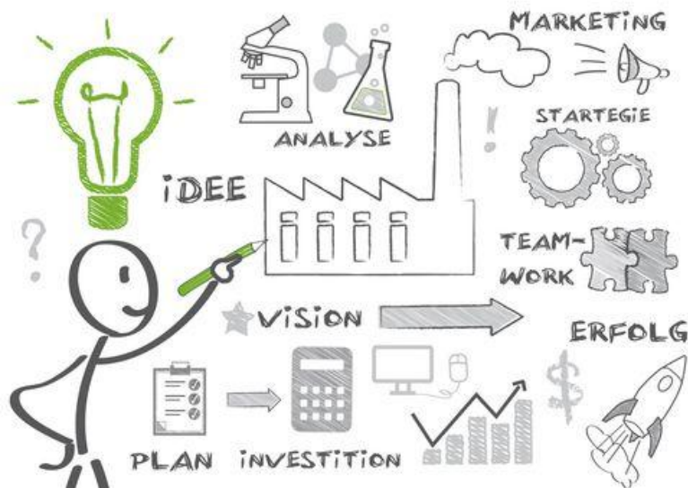
Slika 1. Projekt