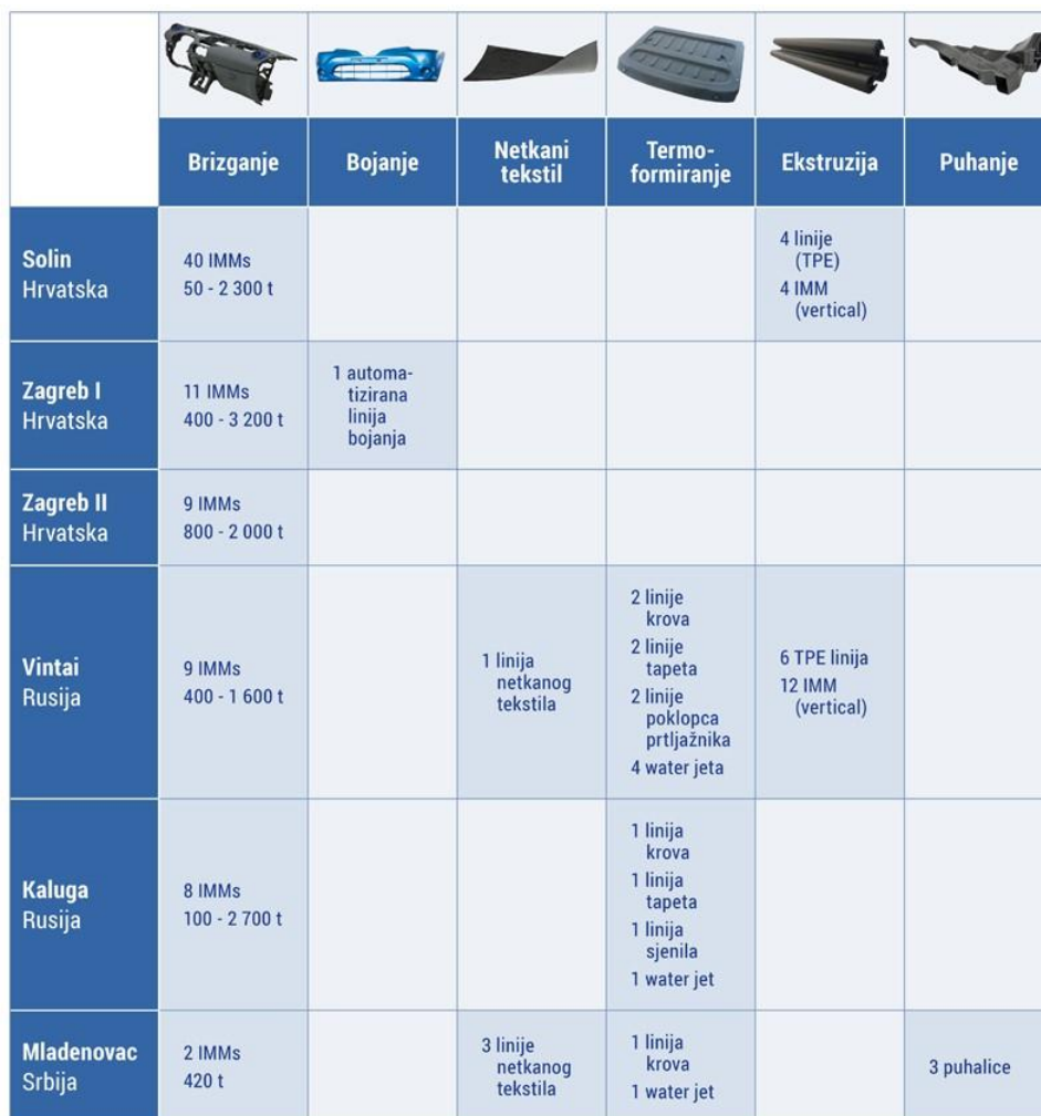
Slika 3. Tehnologije po tvornicama AD Plastik d.d.

AD Plastik ima osam tvornica u pet država. Tehnologije po tvornicama su prikazane na sljedećoj slici: