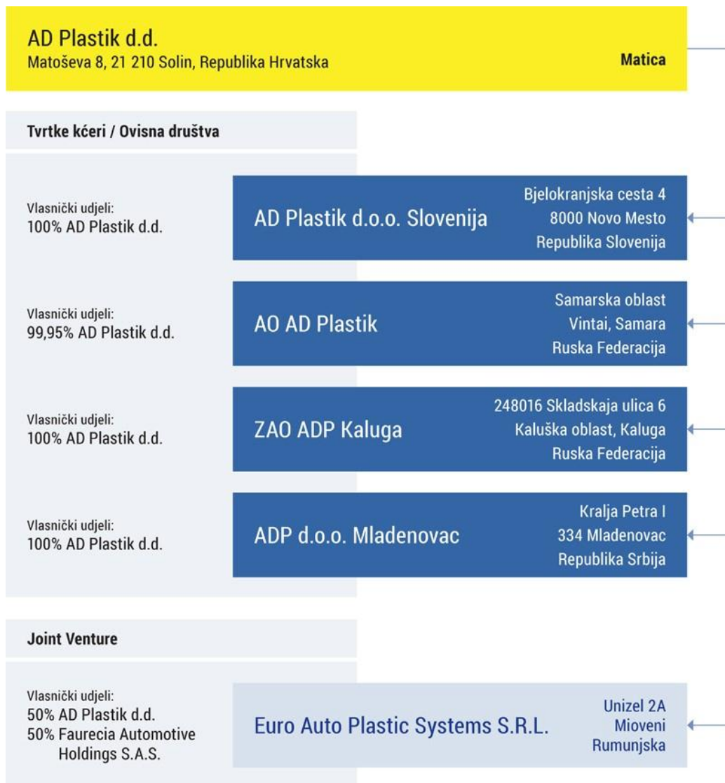
Slika 5. Sastav AD Plastik Grupe