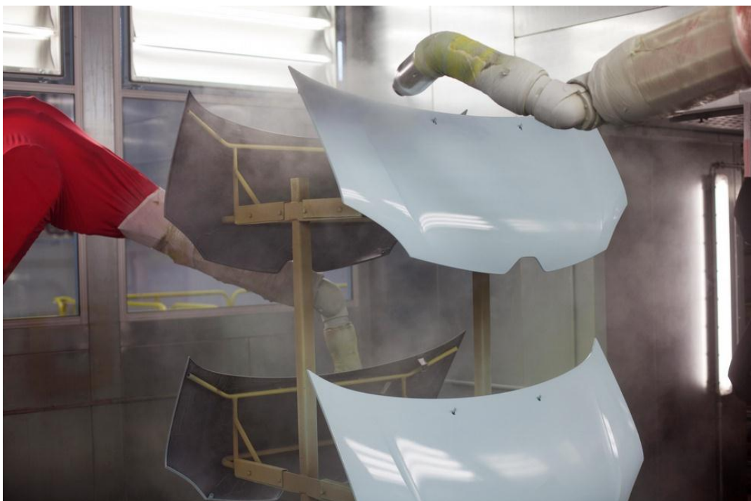
Slika 10. Linija bojanja u AD Plastiku