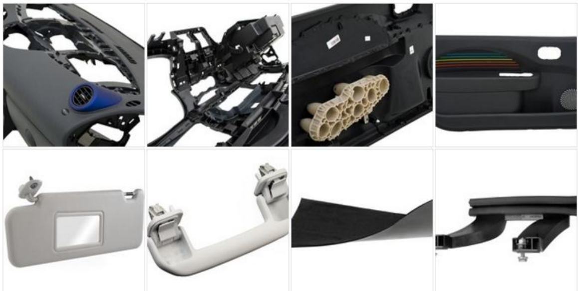
Slika 7. Dio proizvoda AD Plastika koji se ugrađuju u Dacia vozila

U to vrijeme se AD Plastik povezao s razvojnim dobavljačima, uključili u proizvodnju, te započeli s procesom proizvodnjom. Paralelno s ovim poslom, razvijali su nove proizvode za interijer automobila kao što su stranice, obloge i rukohvati koje su razvijali za "Peugeot", te za eksterijer automobila kao što su branici i oblozi ispod rezervoara koje su razvijali za "Peugeot" i "Renault", tako da je njihova proizvodnja trostruko rasla. U roku od dvije godine AD Plastik i partneri ("Simoldes" iz Portugala) završili su proces razvoja, obučili radnike, obavili kompletnu industrijalizaciju proizvodnje (montiranje strojeva, itd.), te su započeli proizvodnju. Proizvodnja u tvornici EURO-APS odvija se na tehnologijama injekcijskog brizganja koja se koristi za preradu plastičnih masa na kojima se proizvode dijelovi za Daciju Logan i Super Nova kao što su branici, instrument table, rukohvati i drugo, te na tehnologijama termooblikovanja koja se koristi u obradi tekstila za proizvodnju krovova, tapeta, obloga za prtljažnike također za Daciju. 75