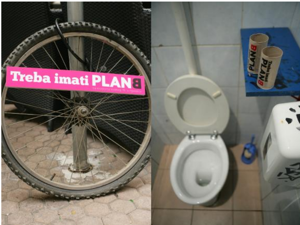
Slika 11. Kampanja- treba imati plan b

4. Sljedeći primjer (što je zaista oksimorn u ovom kontekstu) jest kampanja pod nazivom ‘Treba imati Plan B’ za časopis Plan B, koji u se u trenutku kampanje tek trebao pojaviti na kioscima. Radi se o konceptu sa dva odlična scenarija. U prvom imamo kotač bicikla vezan za stalak za parkiranje bicikala, na kojem se nalazi tabla s natpisom “Treba imati plan B – na kioscima svakog 15. u mjesecu”. Drugi scenarij su obični prazne role WC papira, postavljene u javnim WC-ima, na kojima piše ista stvar. Već nakon samog pogleda kotač i WC-papir, sve vam je jasno: čekam petnaesti i odlazim do kioska po svoj primjerak 8 .