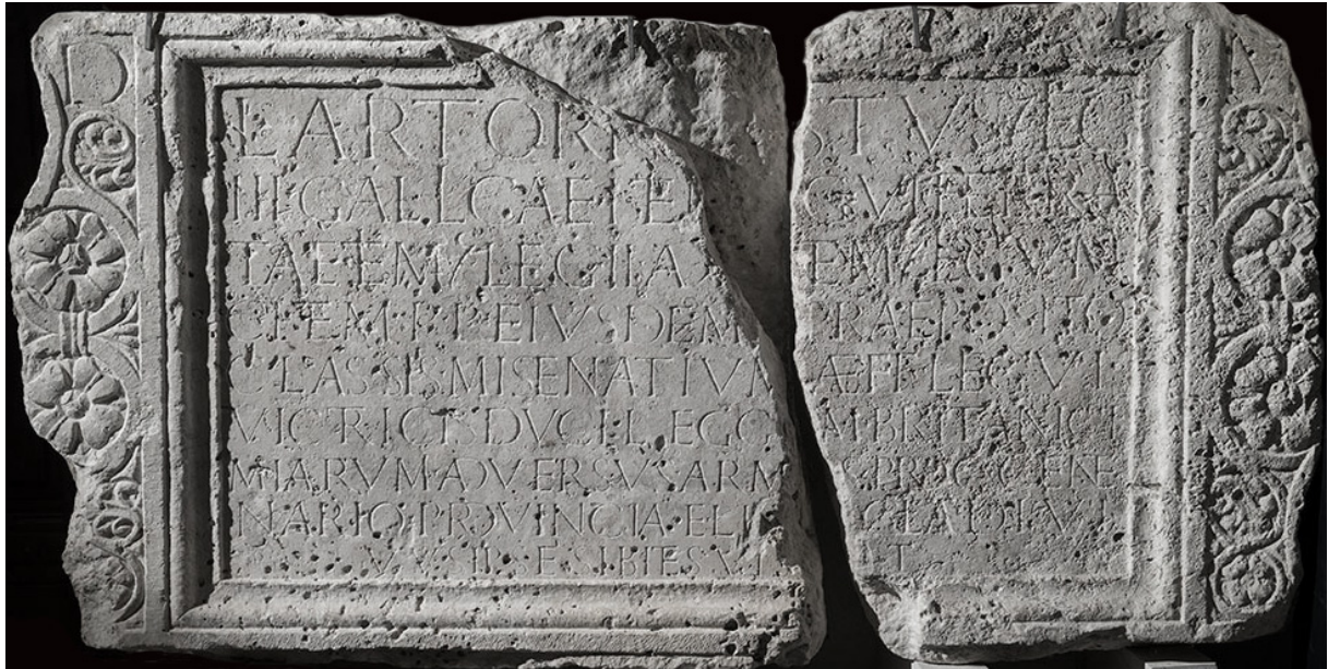
Slika 10. Nadgrobni natpis Luciusa Artoriusa Castusa

Predmetna luka planirana je kao športska i namijenjena je za vezivanje plovila domaćeg stanovništva.