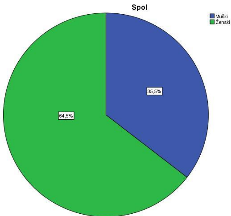
Grafikon 2: Struktura spola

Iz prethodnog grafikona vidljivo je kako je od ispitanih hotela u istraživanju sudjelovalo 64,5% ženskog spola i 35,5% muškog spola.