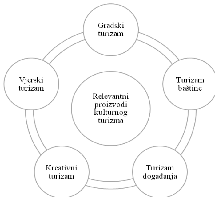
Slika 3.1-1. Relevantni proizvodi kulturnog turizma definirani Strategijom razvoja turizma RH do 2020

turizma događanja, kreativnog turizma i vjerskog turizma predstavljaju potencijalno vodeći proizvod hrvatskog turizma. 18