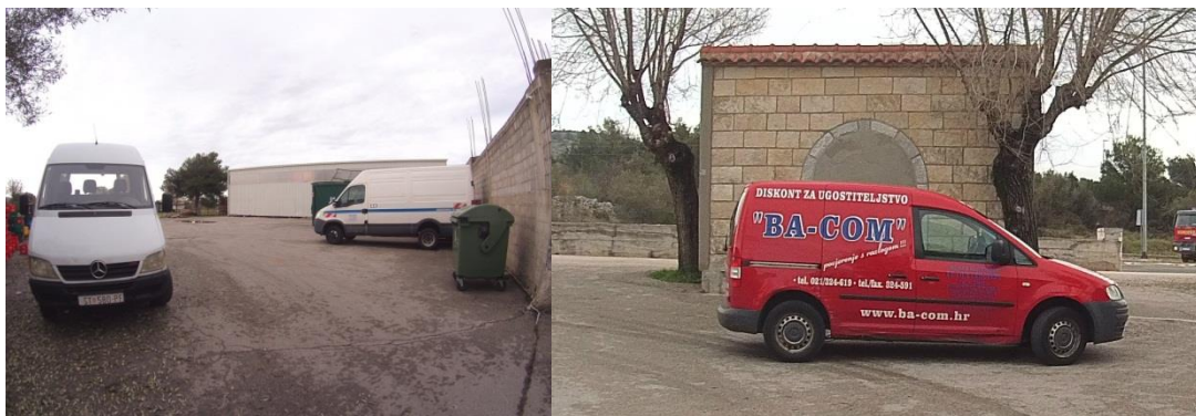
Slike 12 i 13: Transportna vozila

Transport je važan u poslovanju prodajno-distribucijskog centra u Rogoznici jer djelatnici nastoje da se sva roba koju kupci naruče isporuči u najkraćim rokovima, sigurno i kvalitetno. Uz prijevoz robe, transport obuhvaća i poslove koji se odvijaju prije i nakon prijevoza, a to su utovar i istovar robe. Ovaj prodajno-distribucijski centar se koristi kopnenim prijevozom, odnosno sav prijevoz robe se odvija cestovnim prometom. Centar se nalazi na samom ulazu u Rogoznicu, u neposrednoj blizini Jadranske magistrale. Jadranska magistrala je državna cesta koja povezuje razna mjesta duž Dalmacije, što pogoduje bržoj dostavi robe kupcima. Vozni park se zbog izrazite sezonalnosti posla mijenja tijekom godine. Izvan sezone se vozni park sastoji od dva kombija marke Iveco i jednog Caddyja, a taj se broj za vrijeme sezone povećava na četiri kombija i dva Caddyja. Djelatnici dodatna vozila nakon sezone odvođe u distribucijski centar koji se nalazi u Žrnovnici, gdje se nalaze do sljedeće sezone.