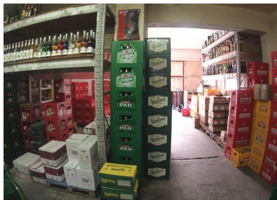
Slika 9: Unutrašnji dio skladišta

Unutar skladišta se nalaze materijali potrebni za prodaju i gotovi proizvodi, odnosno alkoholna i bezalkoholna pića. Dio robe je smješten po policama metalne strukture, s drvenim plohamama. Ostatak robe je upakiran u transportnu ambalažu i smješten na paletama ili na podu, ako su u pitanju pive. Prilikom raspoređivanja robe po skladištu, skladištari se drže određenih pravila. S obzirom da je dio pića upakiran u staklene ambalaže, izrazito je važno da se roba smješta po skladištu sa pažnjom i oprezom kako ne bi došlo do lomova. Roba koja se češće izdaje iz skladišta, smješta se što bliže ulazu u skladište kako bi se olakšao posao i smanjilo vrijeme potrebno za izdavanje robe. Roba koja se rjeđe prodaje se smješta prema stražnjem dijelu skladišta. Kod slaganja robe na police, važno je da se na police koje su nadohvat ruke slaže roba koja se češće izdaje iz skladišta, a na visoke police se slaže roba koja se rjeđe izdaje. Ispod svake robe se nalazi priložena deklaracija koja sadrži naziv proizvoda, bar-kod, te cijenu. Također, radnici svakih deset do petnaest dana provjeravaju rokove na proizvodima kako bi bili sigurni da je roba ispravna. To svakako utječe na kvalitetu usluge jer su onda sigurni da se neće kupcu greškom dostaviti roba kojoj je istekao rok. Skladištari robu koja je lakše težine mogu raspoređivati i slagati na police rukama. Kad se radi o teškoj robi i većim količinama, djelatnici se koriste viličarima koji im olakšavaju posao skladištenja robe.