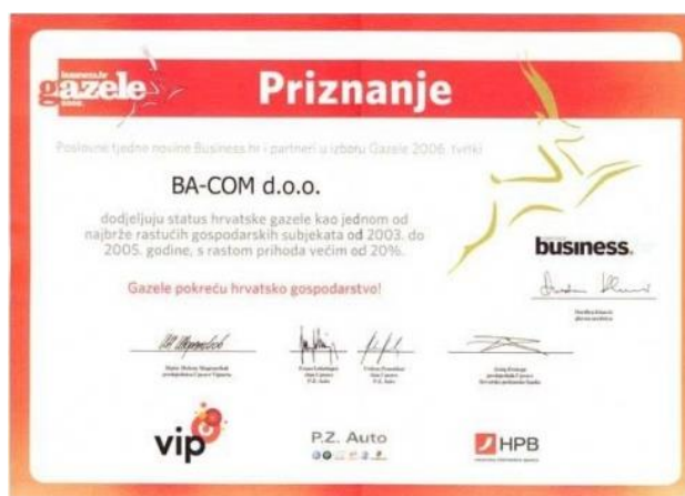
Slika 5: Priznanje hrvatske gazele

Ba-com je 2006. godine dobio status hrvatske gazele kao jedno od najbrže rastućih gospodarskih subjekata od 2003. do 2005. godine, s rastom prihoda većim od 20%. 39