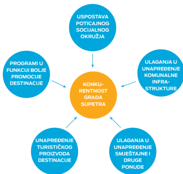
Slika 6. Područja podizanja konkurentnosti turizma grada Supetra