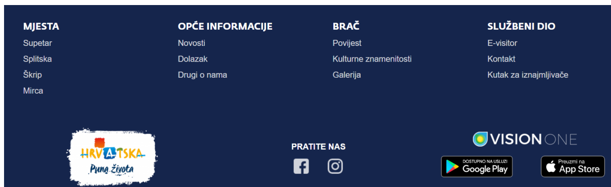
Slika 5. Početna strana internet stranice TZG Supetar