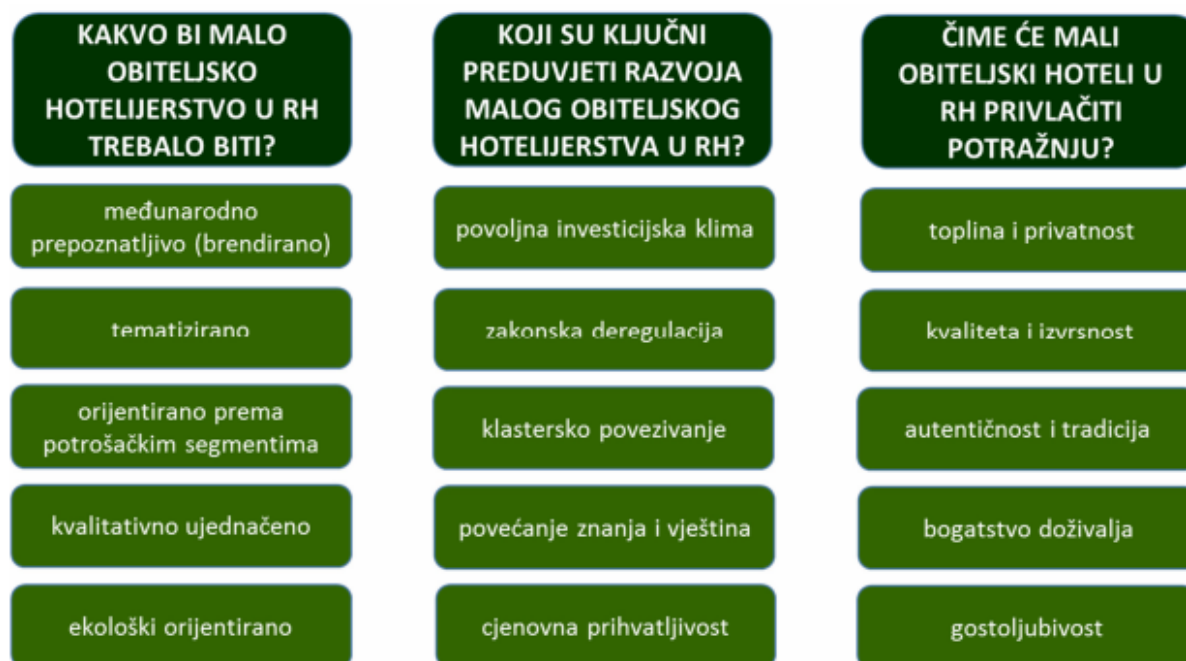
Slika 5.: Temeljne odrednice razvojne vizije maloga obiteljskog hotelijerstva RH