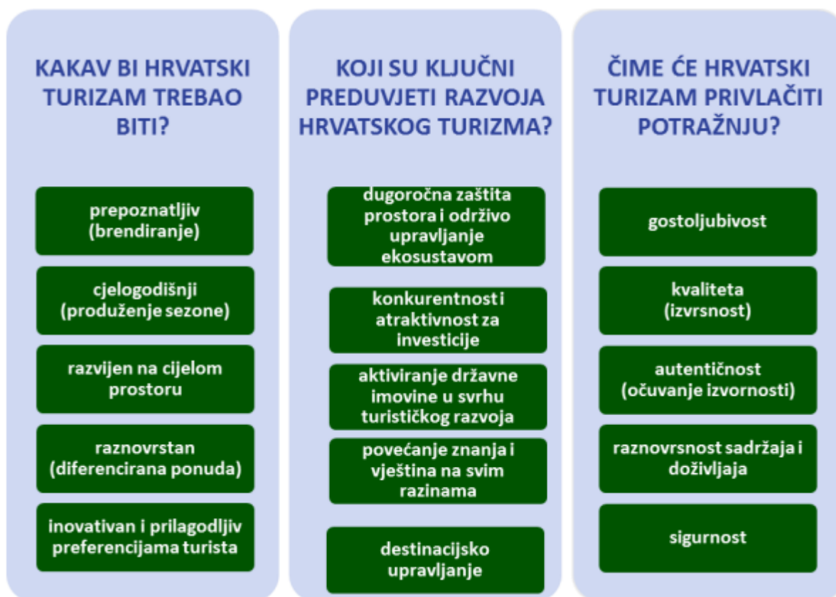
Slika 3.: Sustav vrijednosti nove vizije hrvatskog turizma