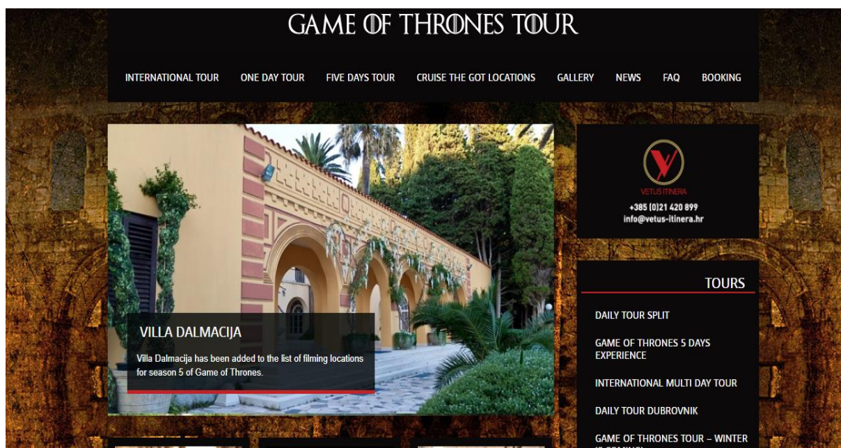
Slika 1. Web stranica Game of Thrones Tour

Vetus Itinera je receptivna putnička agencija koja je specijalizirana za izradu tailor-made putovanja u cijeloj Hrvatskoj. Cilj ove putničke agencije je predstaviti znamenitosti Hrvatske u inovativnom stilu, te stvoriti nezaboravno iskustvo svojim klijentima. Ponuda se temelji na prirodnim ljepotama i bogatoj povjesnoj i kulturnoj baštini. Nudi se široki izbor za sve one koji su u potrazi za avanturom, gastronomskim užicima kao i za parove koji traže romantičnu destinaciju za svoje vjenčanje. U ponudi su jedinstvene Game of Thrones ture koje obuhvaćaju sve lokacije snimanja te popularne serije na ovome području. Na posebnoj web stranici Game of Thrones se nalaze sve ture koje se organiziraju od strane Vetus Itinera kao i opisi putovanja, itinereri, te sadržaj putovanja.