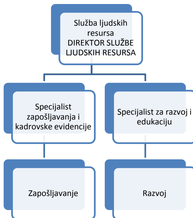
Slika 3. Organigram službe upravljanja ljudskim resursima;

Izvor: Valamar Riviera d.d.; Hotel Lacroma Dubrovnik