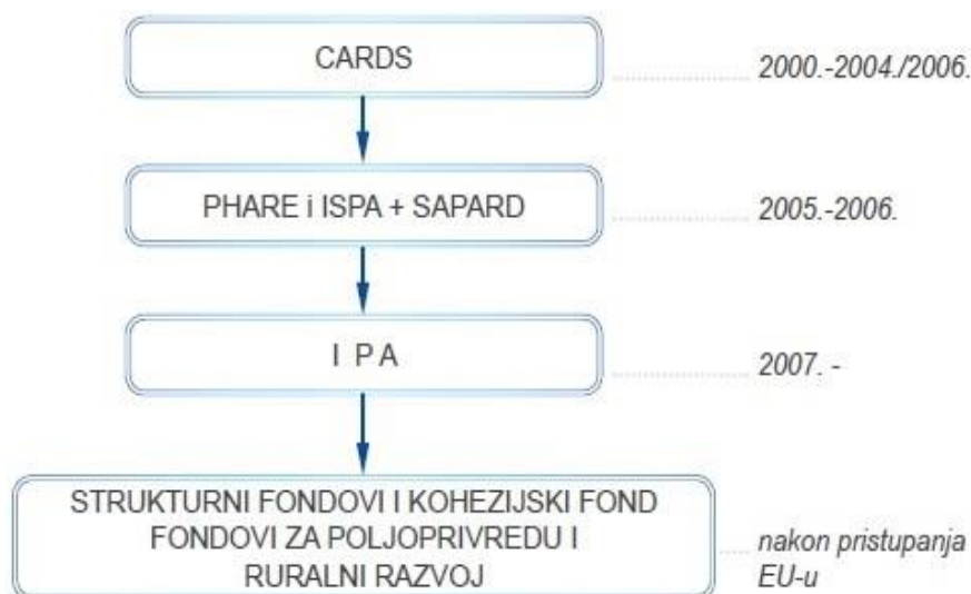
Slika 3:Razvoj financijske pomoći Hrvatskoj

Razvoj financijske pomoći Republici Hrvatskoj od strane Europske unije se stoga odvijao kroz gore opisane financijske instrumente, a nakon ulaska u EU, Republici Hrvatskoj na raspolaganju su bili EU fondovi, slika 3.