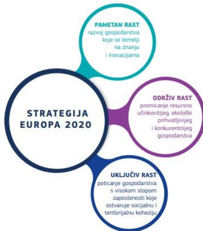
Slika 2: Strategije EUROPA 2020.