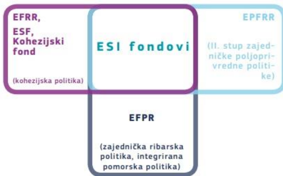
Slika 1: Pet ESI fondova