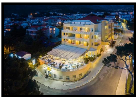
Slika 2. Hotel Villa Bacchus

Mjesto upisa u trgovački sud i broj upisa: Trgovački sud u Splitu, br. MBS: 1574965 sa sjedištem u Baškoj Vodi gdje se nalazi i sama Villa Bacchus.