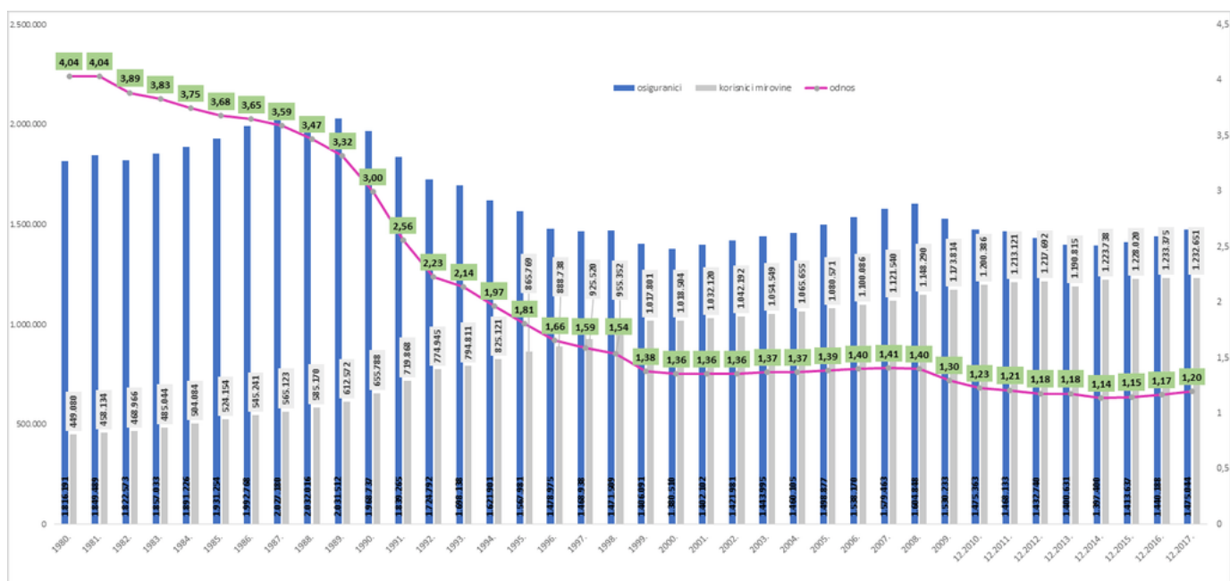
Grafikon 2: Prikaz omjera radnika i umirovljenika