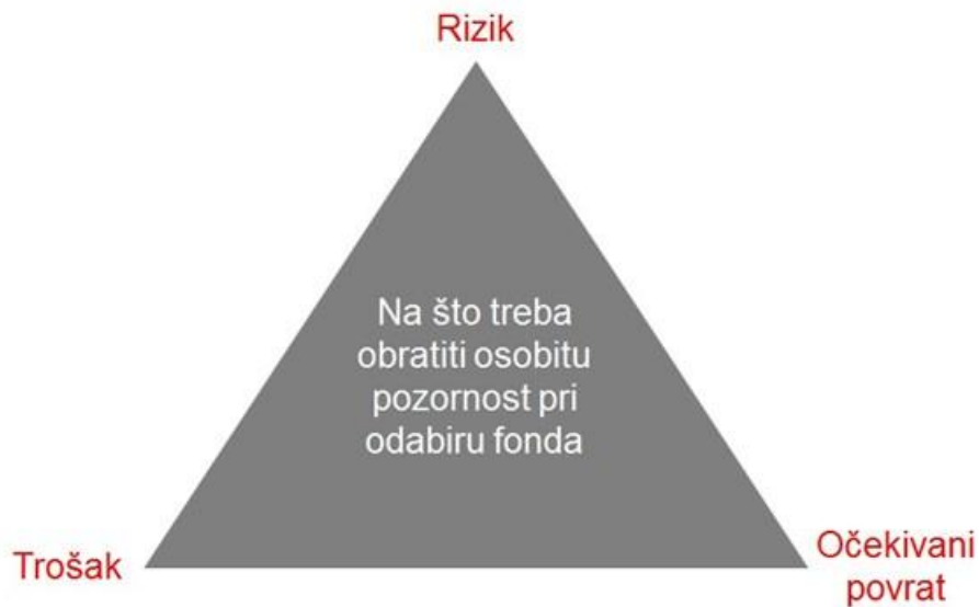
Slika 2: Tri ključna čimbenika za odabir fonda