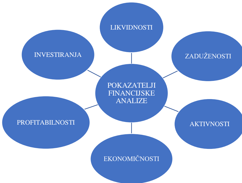
Slika 1. Pregled pokazatelja financijske analize

Pokazatelj je racionalan ili odnosni broj, stavlja jednu ekonomsku veličinu u odnos s drugom. Najveći dio podataka koji se koristi za izračunavanje pokazatelja nalazi se u temeljnim financijskim izvještajima (bilanci, računu dobiti i gubitka, te izvješću o novčanim tokovima), a izbor pokazatelja ovisi o tome kakvu odluku treba donijeti. S obzirom na vremensko razdoblje razlikujemo financijske pokazatelje unutar određenog vremenskog razmaka (najčešće je to godina dana) temeljene na podacima iz računa dobiti i gubitka te financijske pokazatelje koji se odnose na točno određeni trenutak koji se podudara s trenutkom sastavljanja bilance i govori o financijskom položaju društva u tom trenutku. 14 U nastavku će biti detaljno objašnjeni svi pokazatelji.