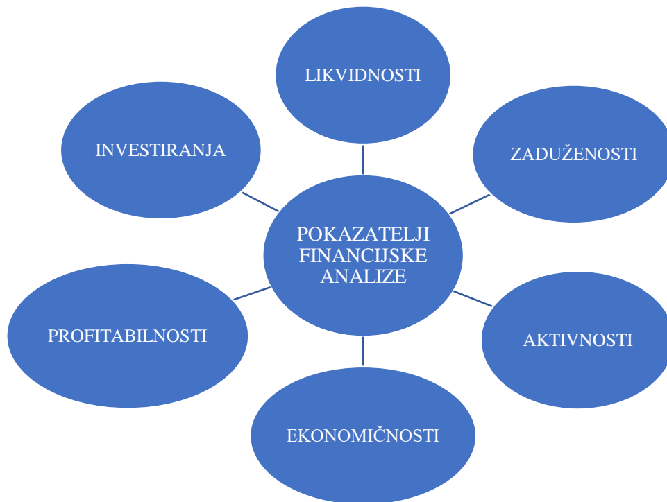
Slika 1. Pregled pokazatelja financijske analize

Pokazatelj je racionalan ili odnosni broj, stavlja jednu ekonomsku veličinu u odnos s drugom. Najveći dio podataka koji se koristi za izračunavanje pokazatelja nalazi se u temeljnim financijskim izvještajima (bilanci, računu dobiti i gubitka, te izvješću o novčanim tokovima), a izbor pokazatelja ovisi o tome kakvu odluku treba donijeti. S obzirom na vremensko razdoblje razlikujemo financijske pokazatelje unutar određenog vremenskog razmaka (najčešće je to godina dana) temeljene na podacima iz računa dobiti i gubitka te financijske pokazatelje koji se odnose na točno određeni trenutak koji se podudara s trenutkom sastavljanja bilance i govori o financijskom položaju društva u tom trenutku. 14 U nastavku će biti detaljno objašnjeni svi pokazatelji.