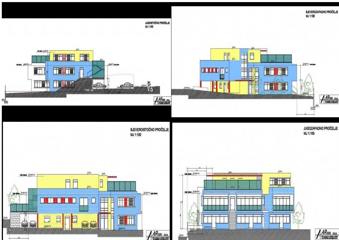
Slika 3: Projektна konstrukcija građevinskog objekta

Poduzeće Ariozo d.o.o. realiziralo je velik broj projekata. Projekti koji su realizirani obuhvaćaju arhitektonske projekte, projektne konstrukcije te izradu armaturnih planova. Slika 3 prikazuje projektну konstrukciju građevinskog objekta s jugoistočnog pročelja, sjeveroistočnog pročelja te sjeverozapadnog pročelja i jugozapadnog pročelja.