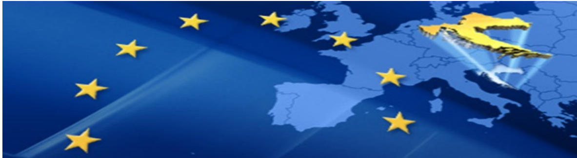
Slika 2. Fondovi Europske unije