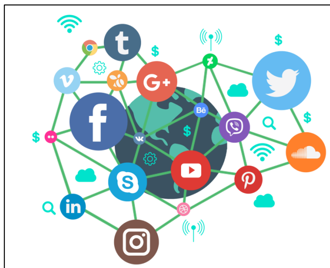
Slika 3-Društvene mreže

čitati o drugima (Stanojević, 2019). Društvene mreže su u današnje vrijeme postale glavno sredstvo komunikacije između korisnika interneta. Isto tako, postale su jako važan marketinški alat, osobito kada govorimo o elektroničkoj usmenoj predaji. „Posljednjih godina društveni mediji su postali nova hibridna komponenta integrirane marketinške komunikacije koje omogućuju potrošačima uspostaviti čvrste odnose sa svojim potrošačima“ (Chu i Kim, 2011, str. 8). Osim privatnih korisnika, društvene mreže imaju i sve više poslovnih korisnika, točnije prema riječima Constantidinesa i Stangoa (2011, str. 22) „sve veći broj tvrtki u različitim industrijama planira integrirati aplikacije društvenih medija u svoje marketinške programe“.