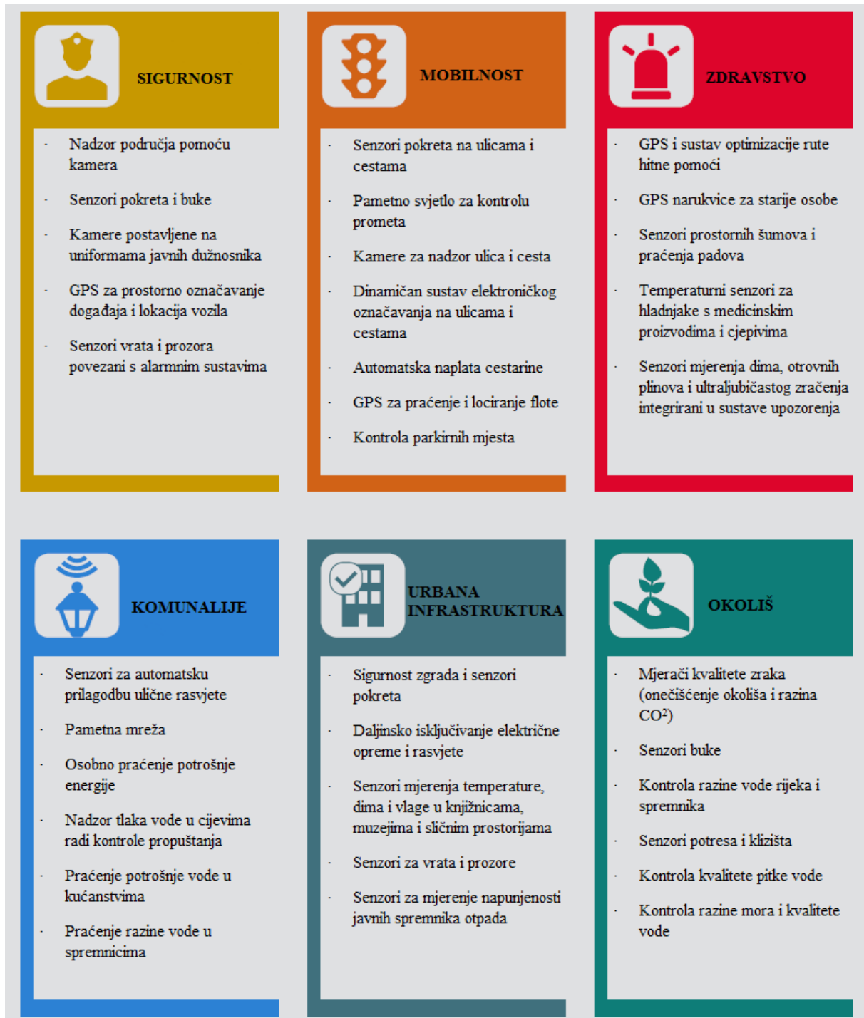
Slika 4 Područja uporabe i primjene senzora

potrošnju energije pa će u budućnosti biti potrebno razviti zeleni internet stvari koji će biti energetski učinkovit (Khan, R. et al. , 2012).