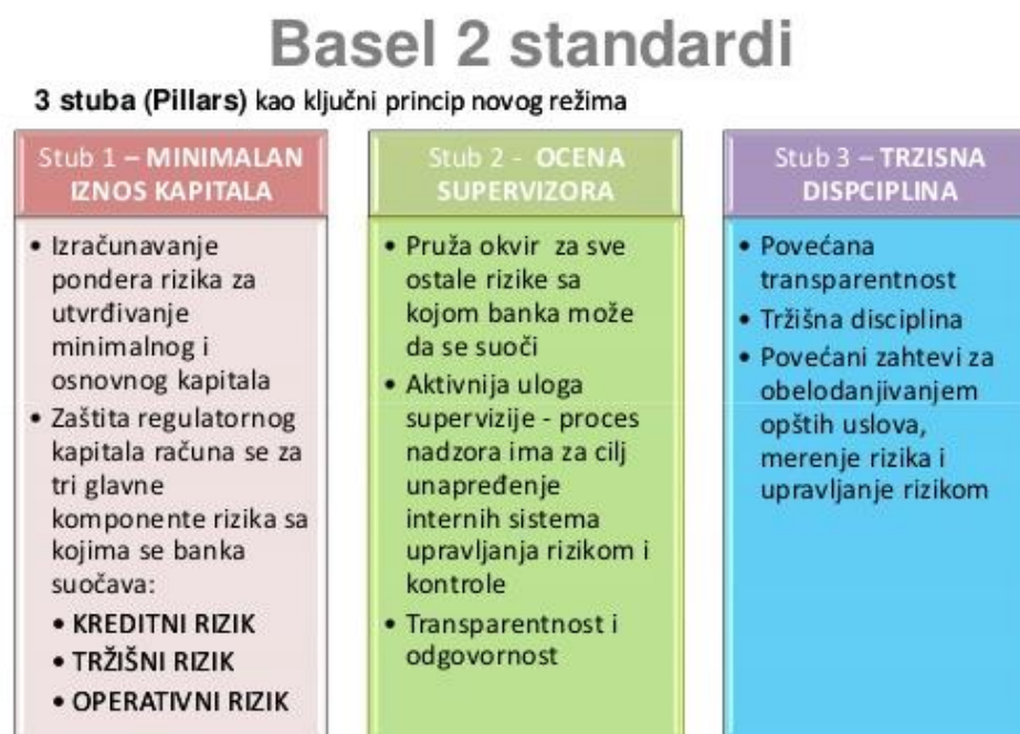
Slika 2. Struktura basela II

Stupovi su međusobno komplementarni i postojanje jednog ne uspijeva bez postojanja drugog, tj svaki od njih omogućuje nešto što druga dva nisu u mogućnosti pružiti. Sva tri stupa imaju za cilj sustavno i kvalitetno upravljati rizicima na mikrorazini, te ostvariti stabilnost financijskog sustava u makroekonomskom pogledu.