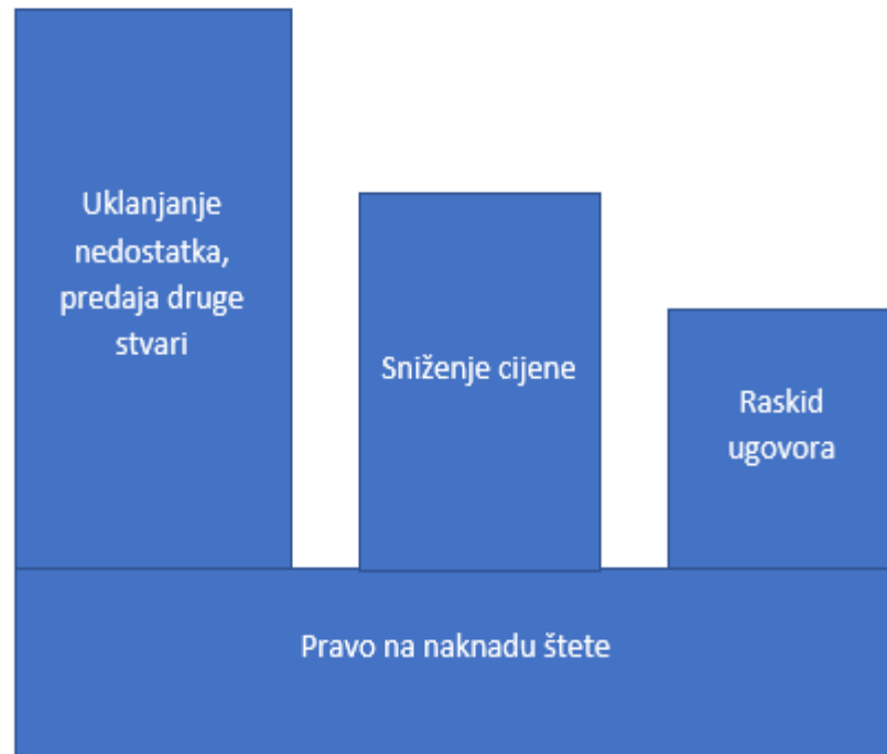
Slika 3: hijerarhijski prikaz kupčevih prava