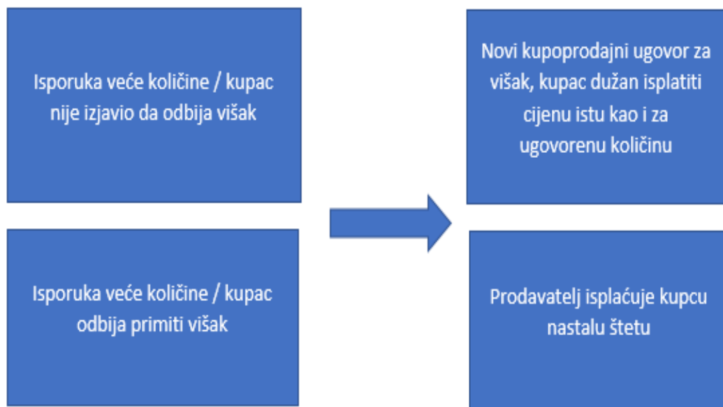
Slika 5: Isporuka veće količine