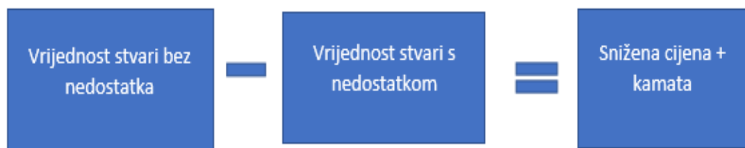
Slika 4: Zahtjev za sniženjem cijene

Kod ugovora o kupoprodaji jedino je i moguć ovakav zahtjev jer je u ovakvim ugovorima kupčeva protučinidba cijena. Relacija ovog prava u odnosu na ostala prava koja kupcu pripadaju s naslova odgovornosti za materijalne nedostatke može se opisati na slijedeći način. Kupcu pravo na sniženje cijene pripada kumulativno sa zahtjevom za naknadu štete. Pravo za sniženjem cijene je podredno u odnosu na pravo zahtjeva za otklanjanjem nedostataka. Drugim riječima, ako kupac za prvo pravo koristio sniženje cijene, gubi mogućnost zahtijevati otklanjanje materijalnih nedostataka tj. predaju stvari bez nedostatka. U suprotnom slučaju ako je prvo tražio predaju stvari bez nedostatka i dalje mu ostaje pravo na sniženje cijene ako mu prvi zahtjev bude odbijen. Kupcu uz isplatu razlike između stvari sa i bez nedostataka pripada i kamata od razdoblja plaćanja do vraćanja. Također, ako je kupac prvo uočio vidljive nedostatke i ostvario svoje pravo na sniženje cijene te nakon toga uočio skrivene nedostatke, kupac može zahtijevati novo sniženje cijene ili raskinuti ugovor. 65