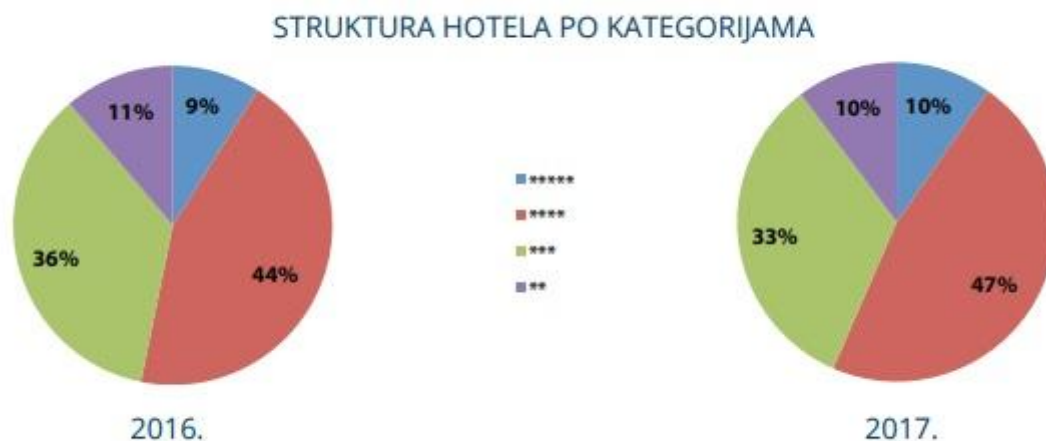
Slika 2: Struktura hotela po kategorijama za 2016. - 2017.