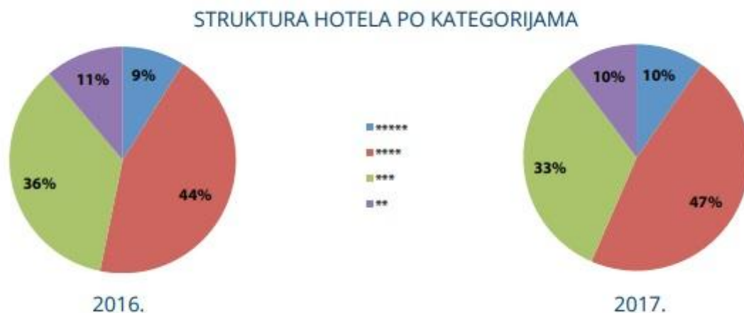
Slika 2: Struktura hotela po kategorijama za 2016. - 2017.