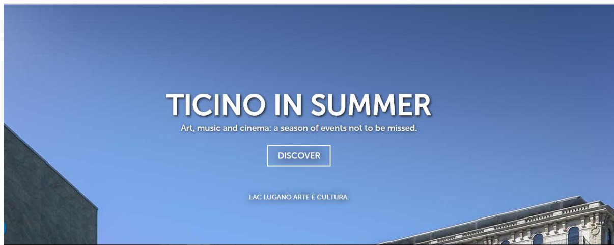
Slika 6: Početna stranica „Ticino Tourism“