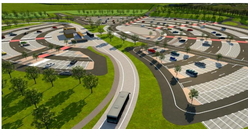
Slika 2: Nacrt za Stourton 'Park&Ride' objekt, Leeds - Engleska

Ograničavanje slobodnog pristupa mjera je većinski korištena kao instrument zabrane prometovanja motornim vozilima u starim povijesnim jezgrama i naseljima. S obzirom na to da su povijesne jezgre i naselja uglavnom neprilagođene visokoj količini motornog prometa u obliku automobila i autobusa, nastoji se prinuditi subjekte da svoja vozila parkiraju na dostupnim površinama grada (najčešće u periferiji) i svoj daljnji put nastave javnim ili posebnim turističkim prijevozom. Spomenuti princip naziva se 'Park&Ride' shema . Ovaj sustav u gradovima omogućavaju 'Park&Ride' objekti ili površine. Takvi su objekti: "mjesto na kojima se ostvaruje transfer putnika između osobnog automobila i vozila javnog prijevoza (željeznice, lake gradske željeznice, tramvaja, autobusa)" 67 .