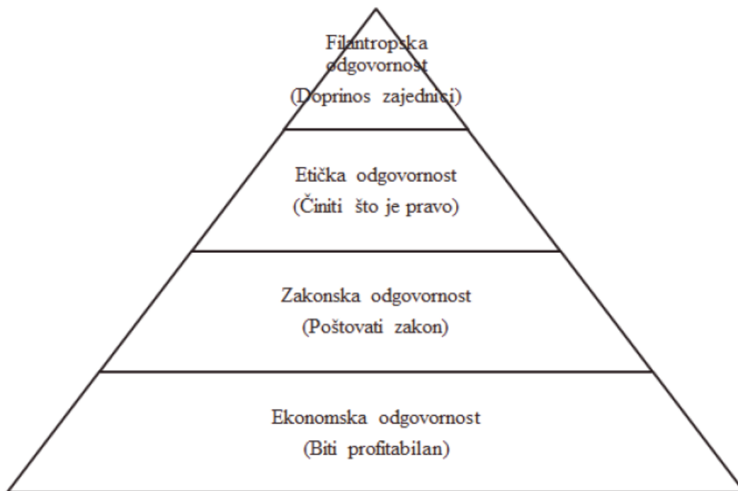
Slika 1: Carollova piramida (vrste društvene odgovornosti)

obuhvaćaju ekonomsku, zakonsku, etičku i filantropsku odgovornost. Faze od dna prema vrhu su se razvijale s vremenom. Naime, na početku je dovoljna bila samo ekonomska odgovornost no protekom vremena odgovornost poslovnog subjekta prema društvenoj okolini se sve više povećava te se naglasak stavlja na doprinos cjelokupnoj zajednici čime se istovremeno postižu i koristi za poduzeće.