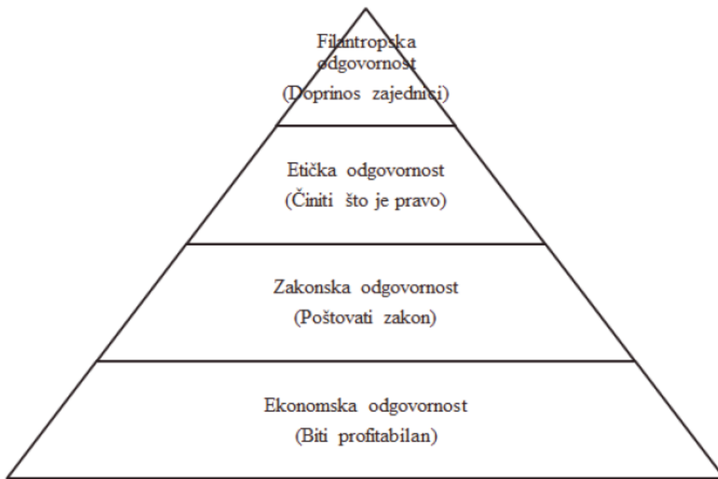
Slika 1: Carollova piramida (vrste društvene odgovornosti)

obuhvaćaju ekonomsku, zakonsku, etičku i filantropsku odgovornost. Faze od dna prema vrhu su se razvijale s vremenom. Naime, na početku je dovoljna bila samo ekonomska odgovornost no protekom vremena odgovornost poslovnog subjekta prema društvenoj okolini se sve više povećava te se naglasak stavlja na doprinos cjelokupnoj zajednici čime se istovremeno postižu i koristi za poduzeće.