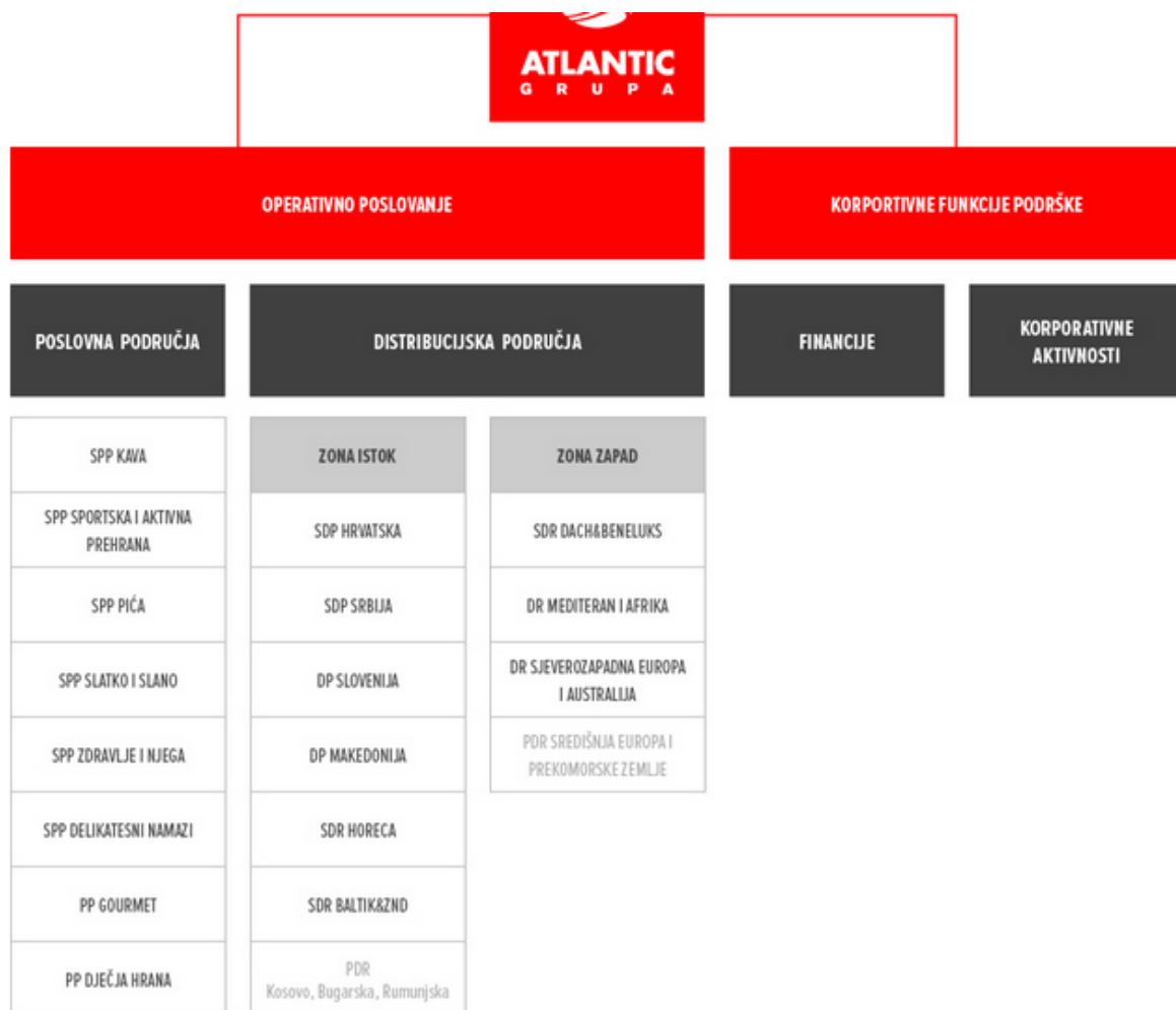
Slika 2: Organizacijska struktura Atlantic Grupe

Atlantic Grupa je jedna od vodećih prehrambenih kompanija u regiji. Proizvodi Atlantic Grupe imaju značajnu prisutnost u Rusiji, zemljama ZND-a i zapadne Europe, a s asortimanom sportske prehrane Atlantic je vodeća europska kompanija u ovom segmentu. Atlantic Grupa ukupno zapošljava oko 5300 ljudi. Sjedište kompanije je u Zagrebu, proizvodni pogoni se nalaze u Hrvatskoj, Njemačkoj, Sloveniji, BiH, Srbiji i Makedoniji. 19 Na slici 2 vidljiva je organizacijska struktura Atlantic Grupe.