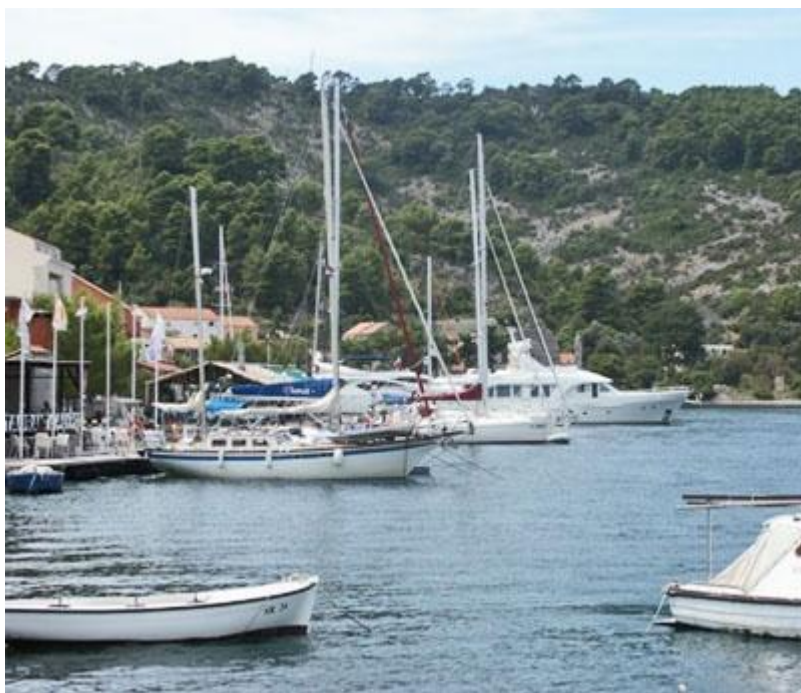
Slika 4: Prikaz luke Polača

Nadalje luka Polače na Mljetu dio je europskog projekta proširenja i spajanja obližnjih otoka i stvaranja trokut luka kako bi se otočni turizam a naročito nautički razvijao.