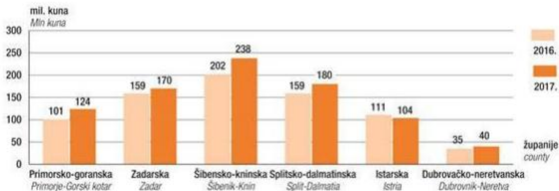
Slika 2: Prihodi od nautičkog turizma za 2016. i 2017. godinu