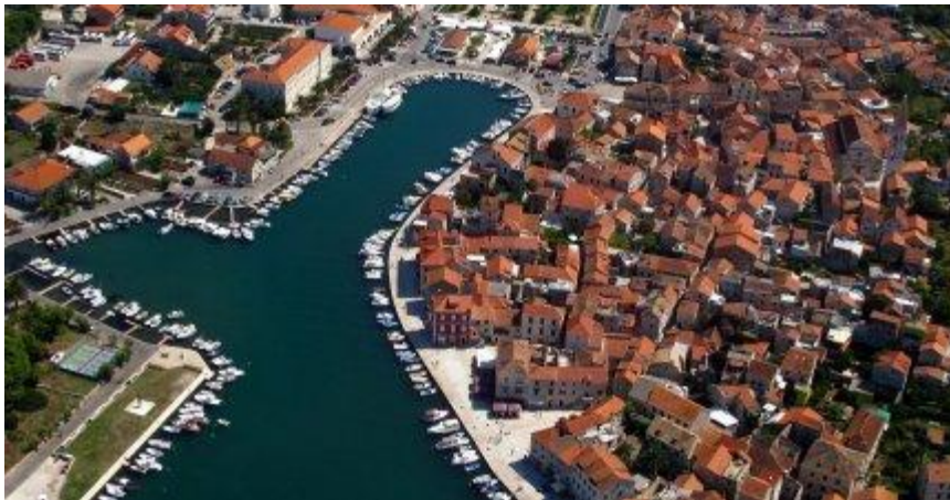
Slika 7: Prikaz luke Stari grad na Hvaru

Hvarska luka spada u one rijetke što ih se ljeti može prijeći s jedne strane na drugu, preko mora, po suhome. Preko brodica, dakako. Jer toliko je jahti i jahtica u njoj natisnuto u sezoni da se more i ne vidi. I sve buja od života. Tradicija uplovljavanja u hvarsku luku starija je od samoga grada Hvara jer su tu, zbog nautičkog položaja luke, zaklon tražili pomorci i ribari još iz doba staroga Pharosa. Hvar ih je kao svjetionik (što samo ime za cijeli otok na grčkome znači) vodio u prirodan zaklon od valova i vjetra. Od samih početaka plovidbe jedrenjaka današnji je Hvar bio u centru svih morskih putova.