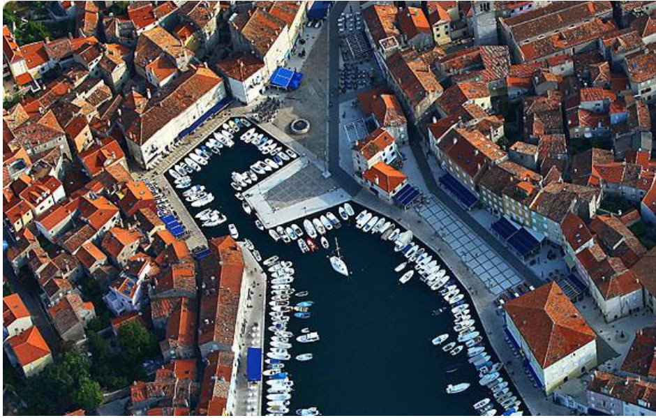
Slika 5: Prikaz luke Cres