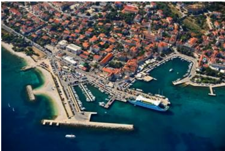
Slika 8: Prikaz luke Supetar

Supetar s Brača gleda na Split i tako je dobro s njime trajektno povezan da je onima koji žive u Splitu, a rade u Supetru, i obrnuto, bliže iz kuće na posao nego mnogim Splićanima iz kvarta u kvart. Između dalmatinske i bračke metropole stoji samo 9,5 nautičkih milja rijetko kad nemirnoga mora. Niknuo usred uvale svetoga Petra, Supetar je glavni grad Brača, njegovo gospodarsko, kulturno i turističko središte, u kojemu živi 3900 stanovnika, što je zapravo cijela petina svih Bračana zajedno. 34