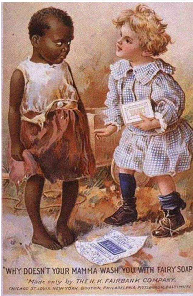
Slika 2: Primjer rasističke reklame

Humor se može pronaći u tiskanim oglasima od sredine do kraja 1800-tih, iako možda neće biti odmah prepoznatljivi jer većina ih izgleda neobično, osobito kada ih se gleda kroz 'cinične i sofisticirane oči' 21. stoljeća. Oglašivači su povremeno koristili humor u obliku smiješnih stihova i slogana, tada su smatrali urnebesnim etničke i rasne karikature i ismijavanja te ih koristili u svojim trgovačkim i izložbenim karticama (plakatima). 107 Na slici 2. prikazan je primjer rasističke reklame.