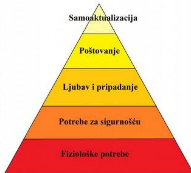
Slika 1: Maslowljeva hijerarhija motiva

Mnogo je klasifikacija motiva, a onu najpoznatiju kreirao je Abraham H. Maslow. Sastoji se od pet grupa motiva poredanih po hijerarhiji i stupnju razvoja čovjeka. To su sljedeći motivi: fiziološki, motivi sigurnosti, društveni, osobni i motivi samodokazivanja. 89 Na slici 1. prikazana je Maslowljeva hijerarhija motiva.