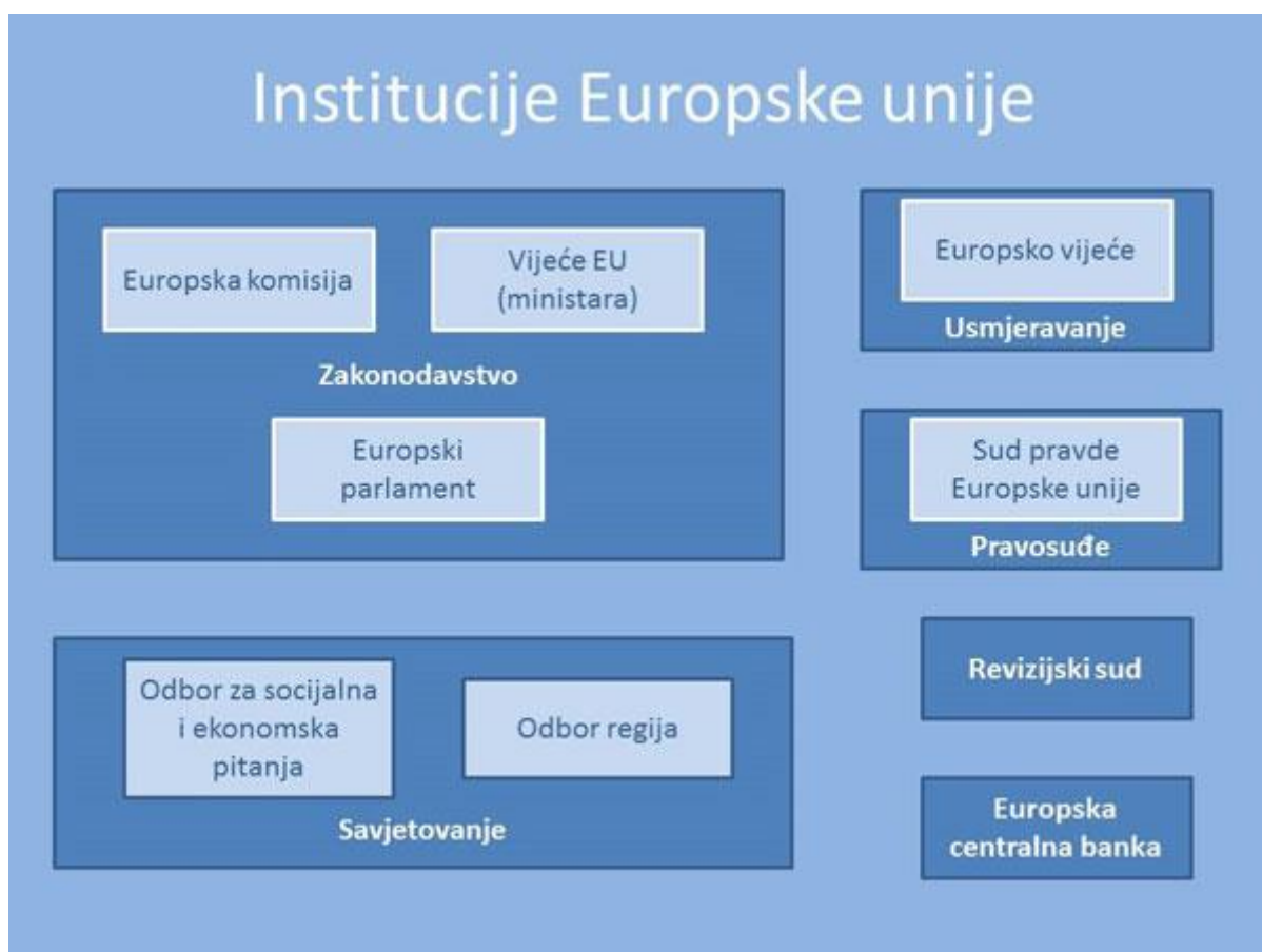
Slika 1: Institucije Europske unije